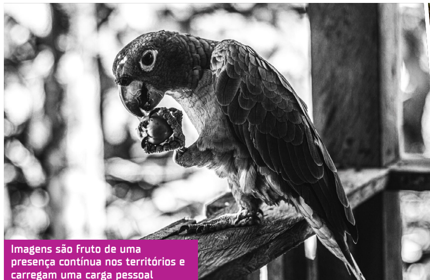
Imagens são fruto de uma presença contínua nos territórios e carregam uma carga pessoal

A trajetória da profissional tem sido marcada por con-