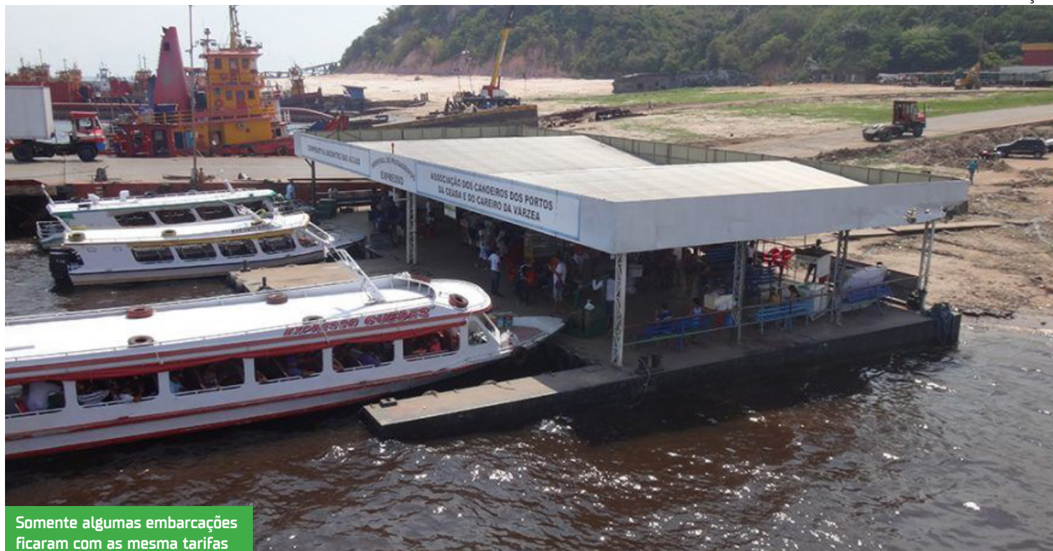
Somente algumas embarcações ficaram com as mesmas tarifas

ções de maior porte — usadas para transporte de passageiros e cargas —, além dos ferryboats, mantêm os preços estabelecidos por tabelas nacionais, da Antaq, e estadual, pela Agência Reguladora de Serviços Públicos Delegados e Contratados do Estado