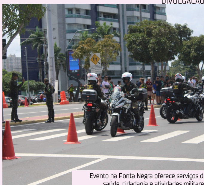
Evento na Ponta Negra oferece serviços de saúde, cidadania e atividades militares

O Comando Militar da Amazônia convida a população a participar da programação e celebrar a Semana do Exército em um dia dedicado à cidadania e à integração com a sociedade.