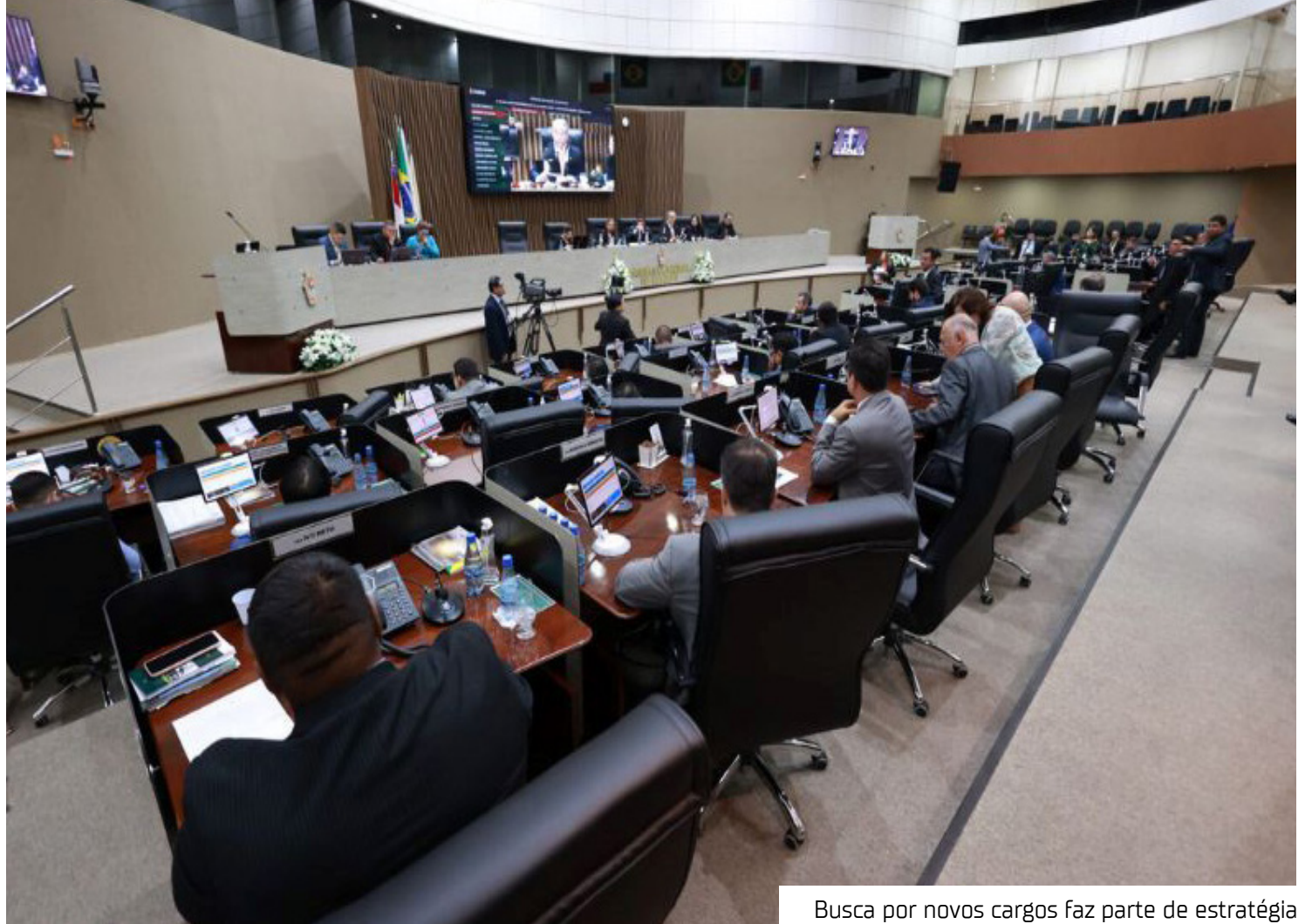
Busca por novos cargos faz parte de estratégia

Para especialistas, esse tipo de articulação é comum no sistema político. "É comum esse tipo de movimentação.