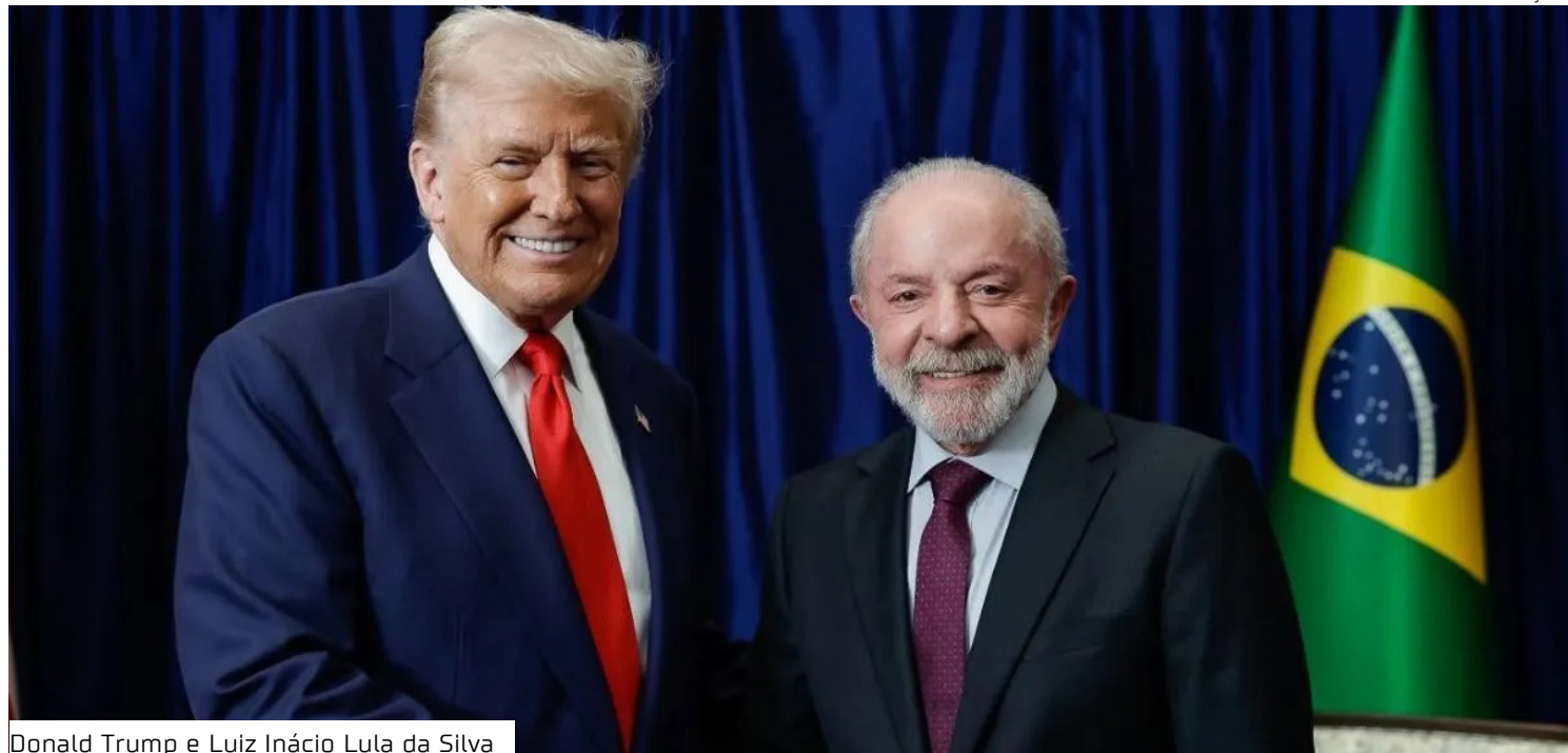
Donald Trump e Luiz Inácio Lula da Silva

rio, do lado brasileiro, todos os contêineres que saem são escaneados.