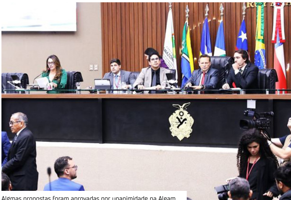
Algumas propostas foram aprovadas por unanimidade na Aleam.

A Assembleia Legislativa do Amazonas (Aleam) realizou a Ordem do Dia com a análise de 18 matérias legislativas na pauta de votação. A sessão foi conduzida pelo presidente em exercício, deputado Adjuto Afonso (União Brasil), e resultou na aprovação de propostas, especialmente nas áreas de saúde e valorização do servidor público.