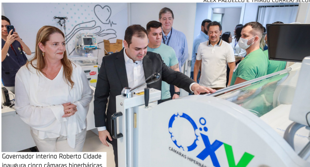
Governador interino Roberto Cidade inaugura cinco câmaras hiperbáricas

estrutura foi ampliada ao longo dos últimos anos e hoje conta com cerca de 360 leitos, consolidando-se como o principal hospital de alta complexidade da região Norte. A unidade também reúne o maior parque diagnóstico da região, com equipamentos modernos que dão suporte a procedimentos complexos e diagnósticos de alta precisão.