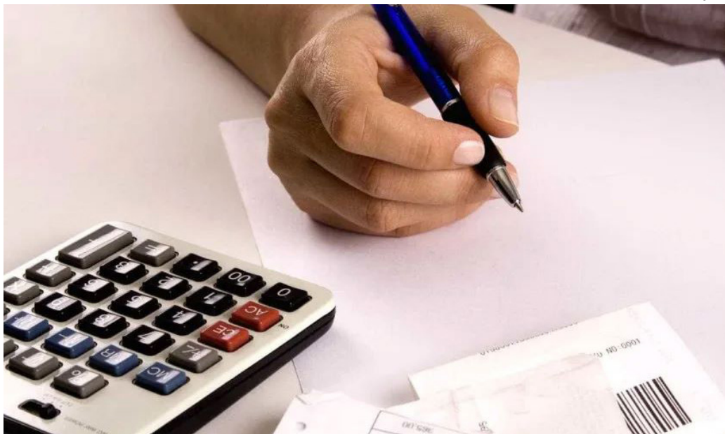
Hoje há um contingente de 81,7 milhões de pessoas que estão com contas atrasadas em todo o país