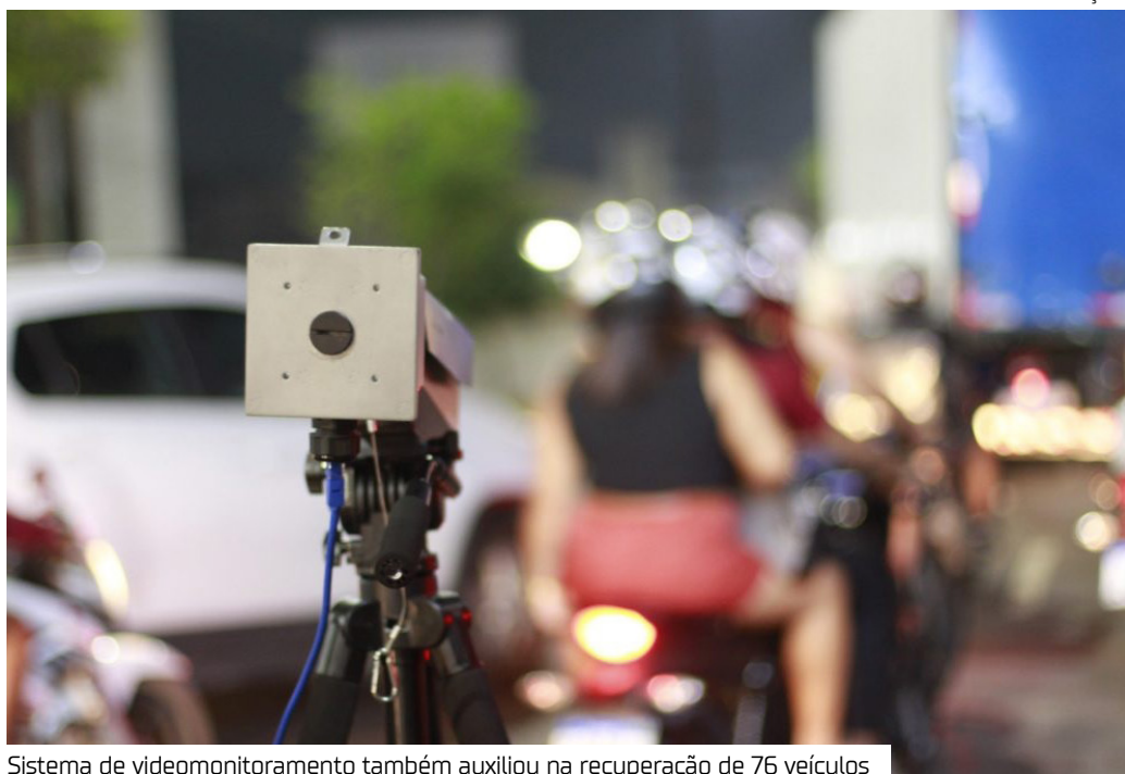
Sistema de videomonitoramento também auxiliou na recuperação de 76 veículos

O Cerco Inteligente de Videomonitoramento, o "Paredão" registrou, durante o mês de março, a captura de 59 foragidos com mandado de prisão em aberto em Manaus, segundo dados divulgados, na sexta-feira (10), pela Secretaria de Segurança Pública do Amazonas (SSP-AM).