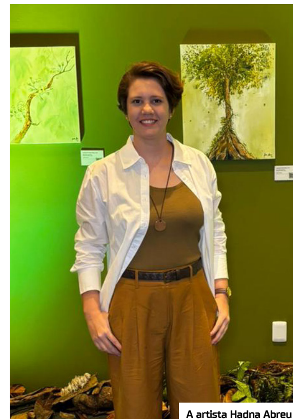
A artista Hadna Abreu