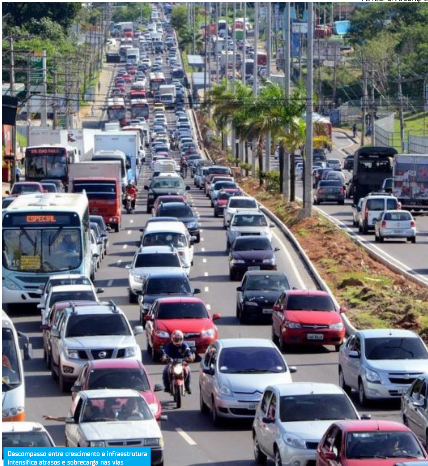
Descompasso entre crescimento e infraestrutura intensifica atrasos e sobrecarga nas vias

“Na volta é ainda pior, enfrente engarrafamentos na