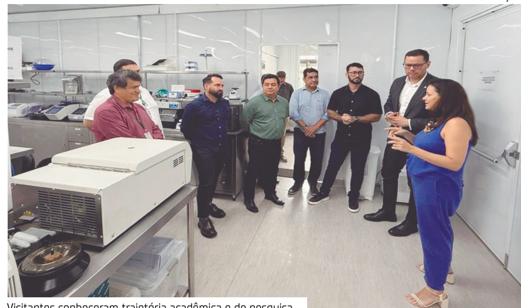
Visitantes conheceram trajetória acadêmica e de pesquisa