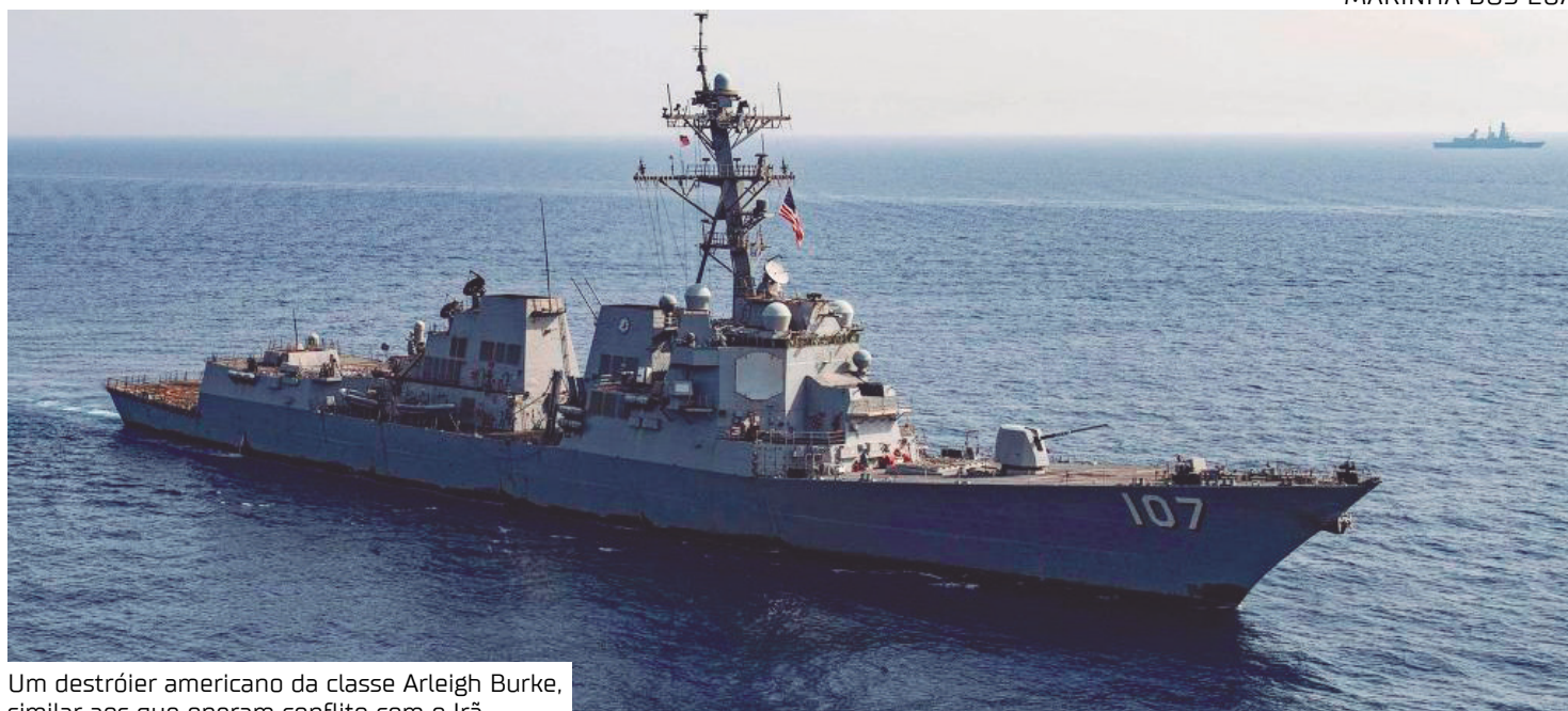
Um destróier americano da classe Arleigh Burke, similar aos que operam conflito com o Irã

Na prática, navios de guerra patrulham a área e orientam embarcações comerciais a in-