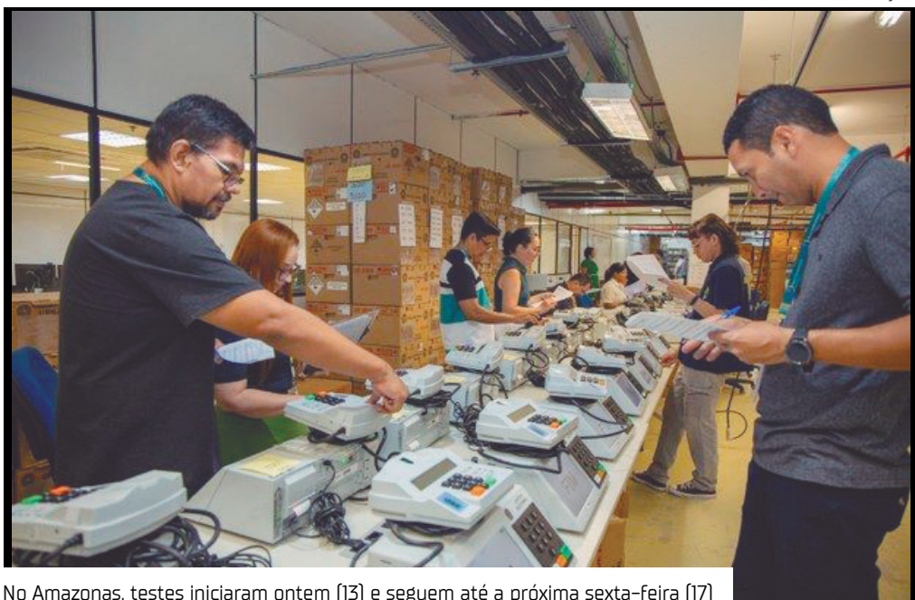
No Amazonas, testes iniciaram ontem (13) e seguem até a próxima sexta-feira (17)

O Tribunal Regional Eleitoral do Amazonas (TRE-AM) participa, nesta semana, do 17º Simulado Nacional de Hardware das urnas eletrônicas, ação coordenada pelo Tribunal Superior Eleitoral (TSE) e realizada simultaneamente em todos os Tribunais Regionais Eleitorais do país. O procedimento tem como objetivo testar o funcionamento dos equipamentos que serão utilizados nas Eleições 2026, reforçando a segurança, a transparência e a confiabilidade do processo eleitoral.