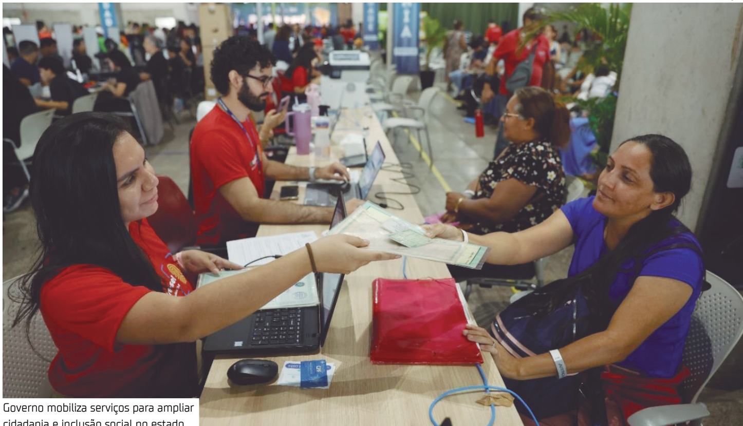
Governo mobiliza serviços para ampliar cidadania e inclusão social no estado

A Secretaria de Segurança Pública (SSP-AM), por meio do Instituto de Identificação Aderson Conceição de Melo (IIACM), participa com a emissão da Carteira de Identidade Nacional (CIN). A estrutura conta com 13 guichês em funcionamento diário, com capacidade para até 450 aten-