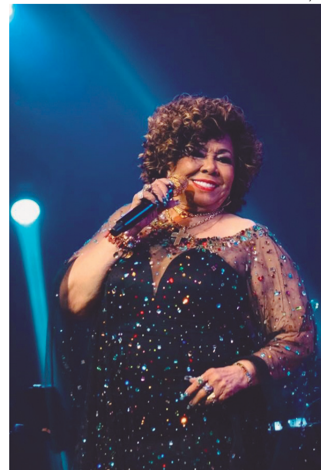
Show acontece no dia 1º, no Nova Era Hall Studio 5

Markado para o feriado de 1º de maio, quando se celebra o Dia do Trabalhador, o show acontece poucos dias antes do Dia das Mães, sendo uma ótima opção de presente para a data.