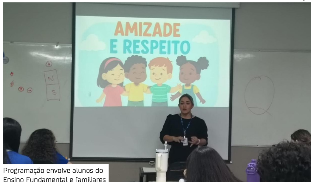
Programação envolve alunos do Ensino Fundamental e Familiares

As ações principais são direcionadas aos alunos do Ensino Fundamental I e II, fase em que as relações sociais se tornam mais complexas e o diálogo sobre limites e respeito mútuo se faz essencial. Através da dinâmica “Minha atitude faz a diferença”, as crianças serão provocadas a identificar comportamentos que, muitas vezes camuflados sob a justificativa de “brincadeira”, configuram exclusão e ofensa. A proposta utiliza elementos lúdicos para facilitar a expressão de