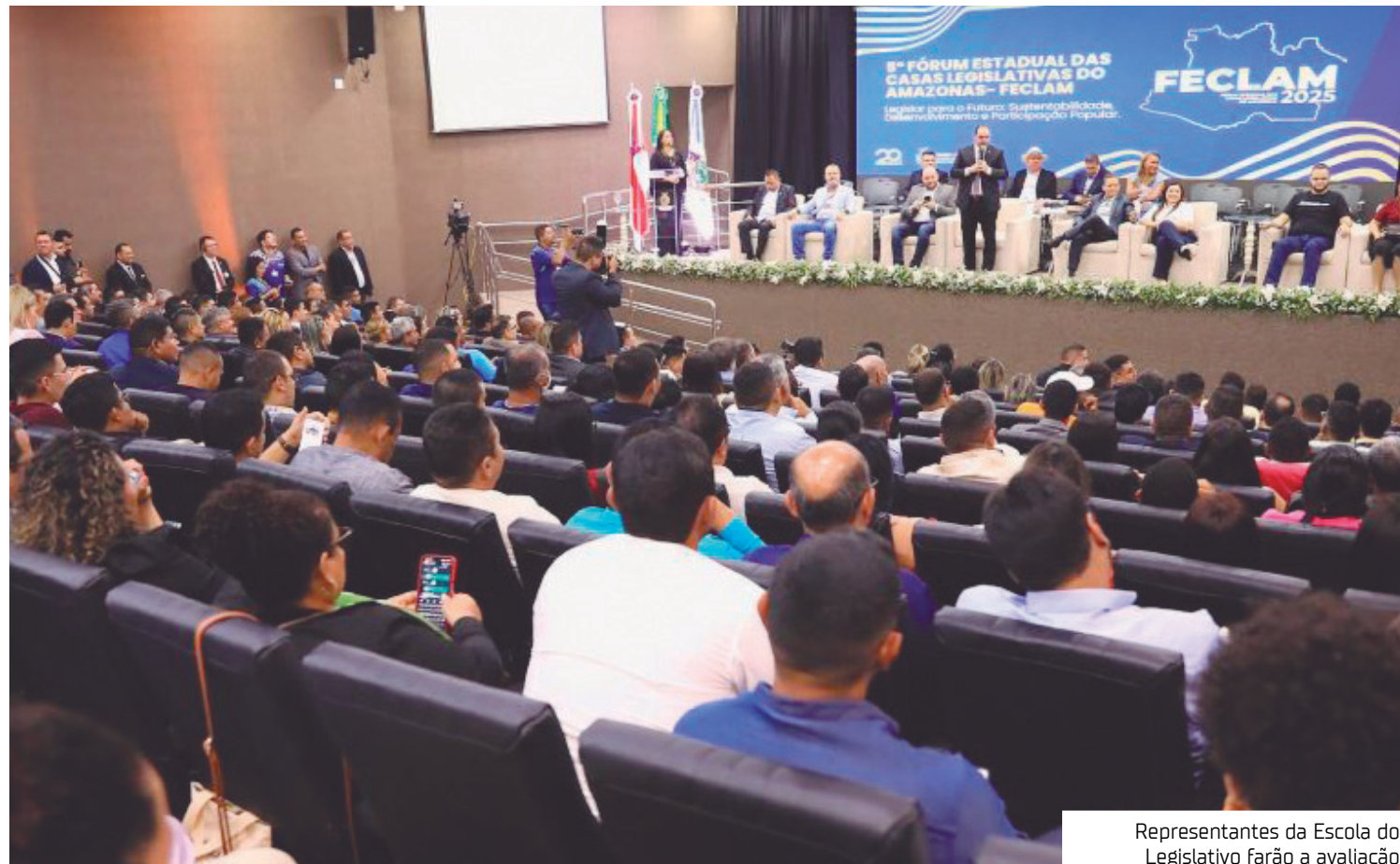
Representantes da Escola do Legislativo farão a avaliação

Até a última sexta-feira (10), estavam inscritas as Câmaras dos municípios de Envira, Barreirinha, Parintins, Lábrea, Maraã, Alvarães, Santa Isabel do Rio Negro, Anamá, São Gabriel da Cachoeira, Borba, Presidente Figueiredo, Caruarí e Canutama. Os projetos encaminhados contemplam ações desenvolvidas ou em execu-