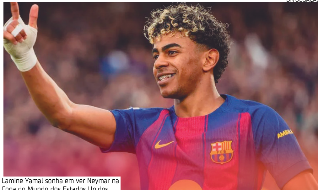
Lamine Yamal sonha em ver Neymar na Copa do Mundo dos Estados Unidos