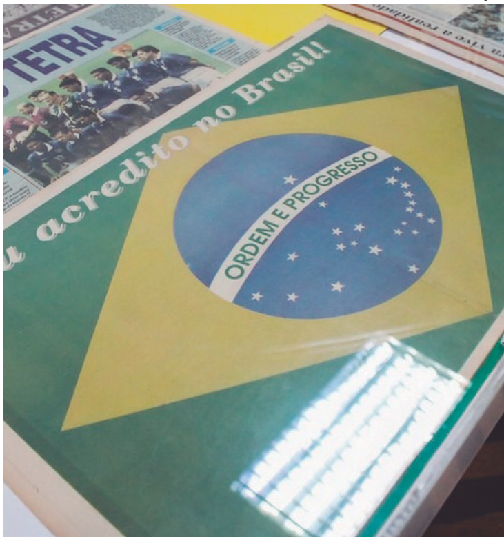
Segunda parte da exposição gratuita busca ampliar o acesso da população ao acervo histórico da biblioteca