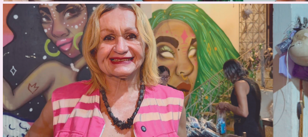
Produção reúne histórias reais e evidencia a relação entre saúde pública e direitos humanos