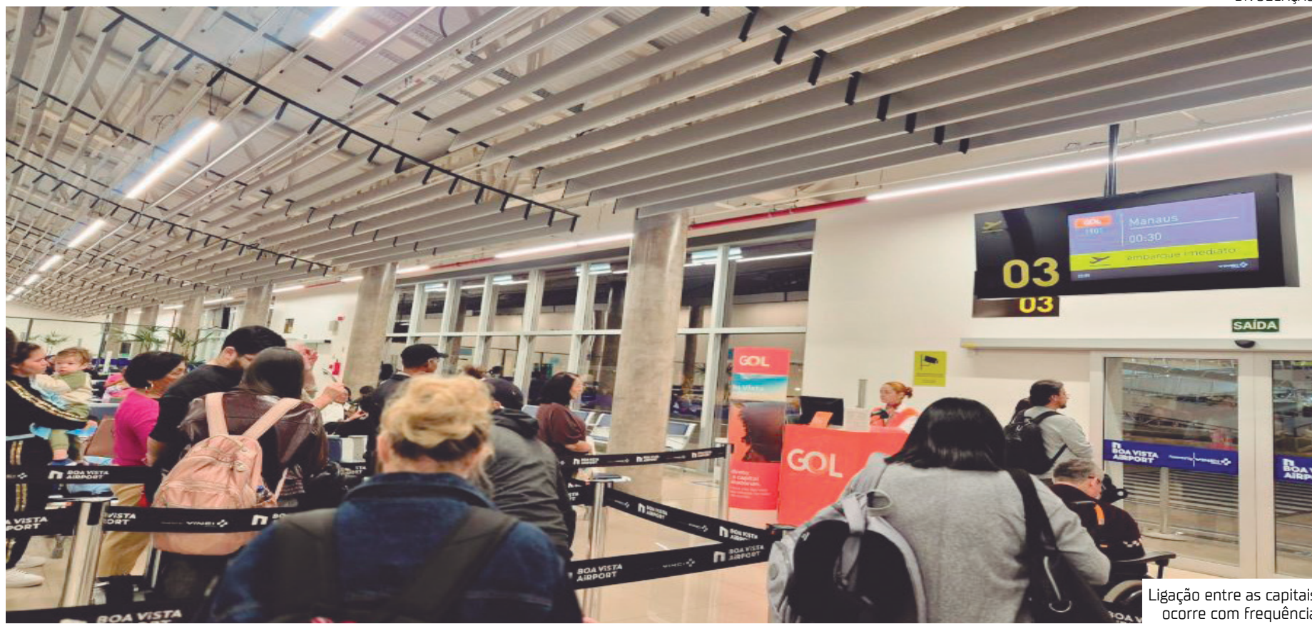
Ligação entre as capitais ocorre com frequência

A nova rota tem um papel fundamental em aproximar pessoas e encurtar distâncias em mercados estratégicos, facilitando o fluxo de passageiros, negócios e turismo regional. "Estar presente