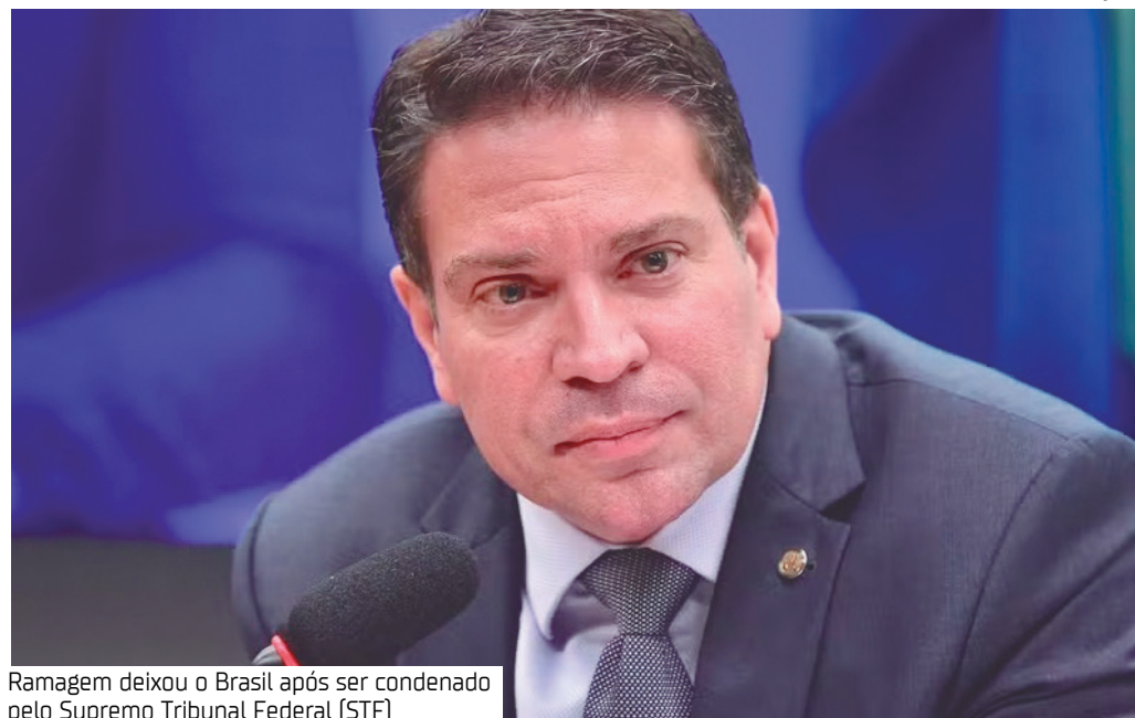
Ramagem deixou o Brasil após ser condenado pelo Supremo Tribunal Federal (STF)

O ex-deputado federal Alexandre Ramagem (PL-RJ) foi preso pelo Serviço de Imigração e Controle de Aduanas dos Estados Unidos (ICE), ontem (13), segundo informações divulgadas pela Polícia Federal.