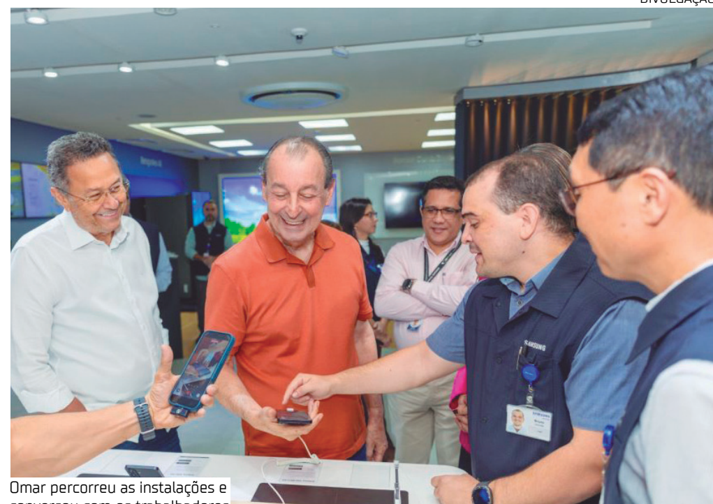
Omar percorreu as instalações e conversou com os trabalhadores

Omar ressaltou que a decisão contribuiu para consolidar o Amazonas como um dos principais polos do setor no mundo. "Hoje somos o segundo maior produtor de ar-condicionado do mundo, atrás apenas da China. Isso aconteceu porque fizemos o PPB funcionar e tornar viável produzir aqui", explicou.