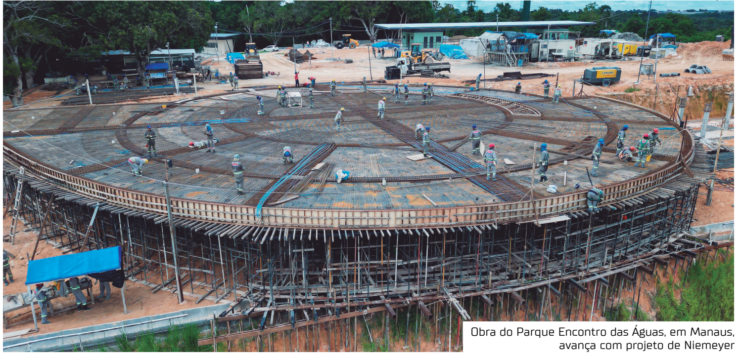
Obra do Parque Encontro das Águas, em Manaus, avança com projeto de Niemeyer

A infraestrutura de esgotamento sanitário avança na Estação de Tratamento de Esgoto (ETE), assim como a elétrica de postes de iluminação. No restante do parque, operários e engenheiros avançam com a pavimentação de calçadas, confecção dos postes metálicos, gradil e instalações