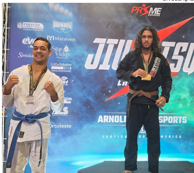
Cascas-grossas do paradesporto do amazonense faturam medalhas