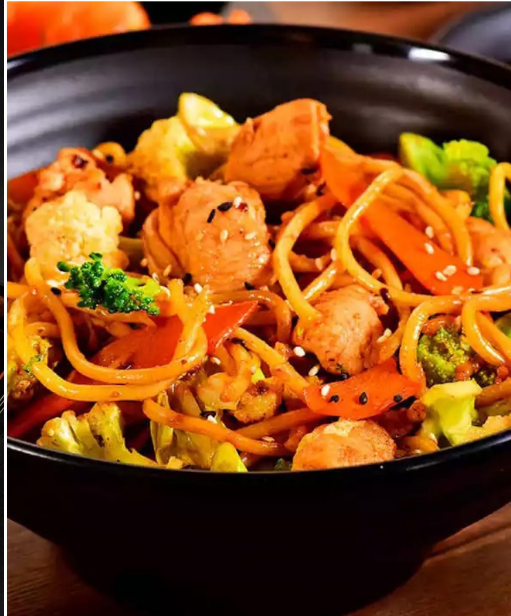
Nos dias 16 e 17, evento gratuito reúne gastronomia oriental, concursos, dubladores e atrações musicais