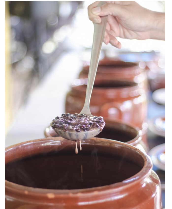
Rodízio de peixes, feijoada e pratos com releituras contemporâneas