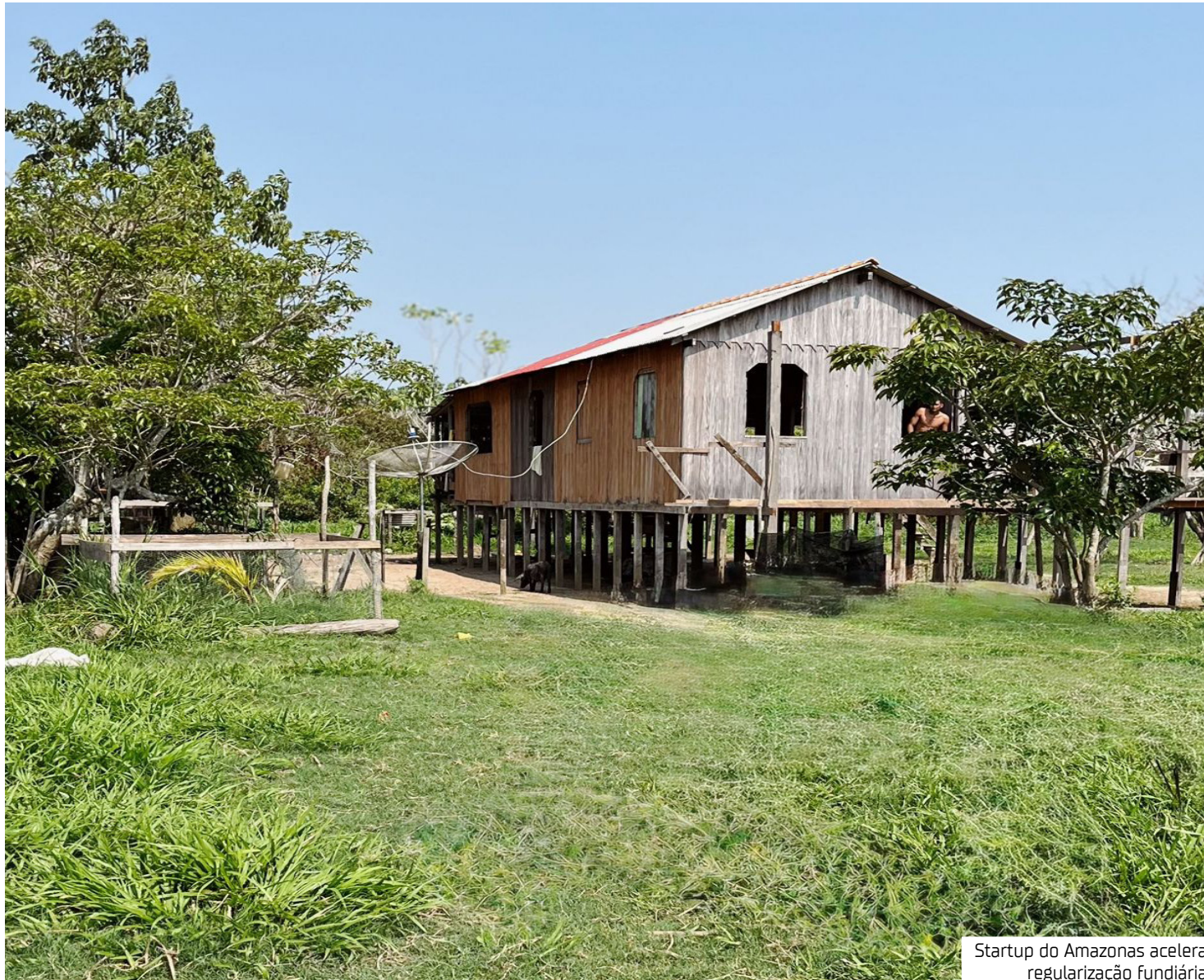
Startup do Amazonas acelera regularização fundiária

Para Belmont, esse é o grande diferencial da ferramenta criada, pois permite alcançar não somente a população que vive na capital, mas também produtores