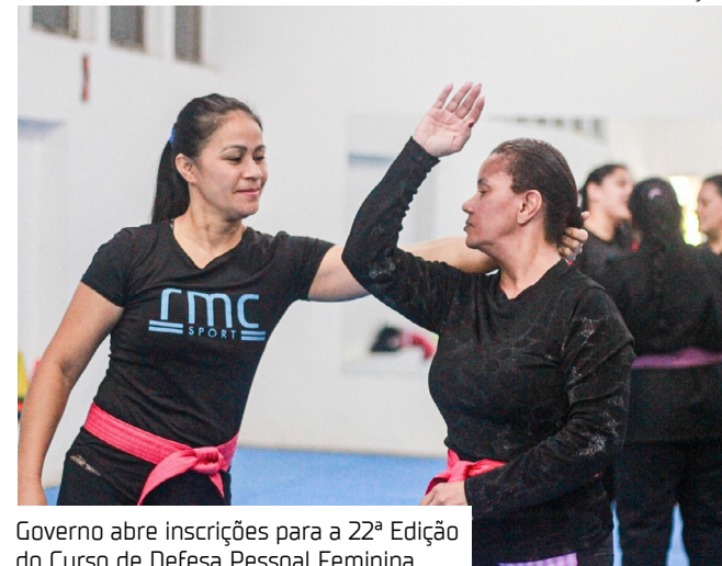
Governo abre inscrições para a 22ª Edição do Curso de Defesa Pessoal Feminina