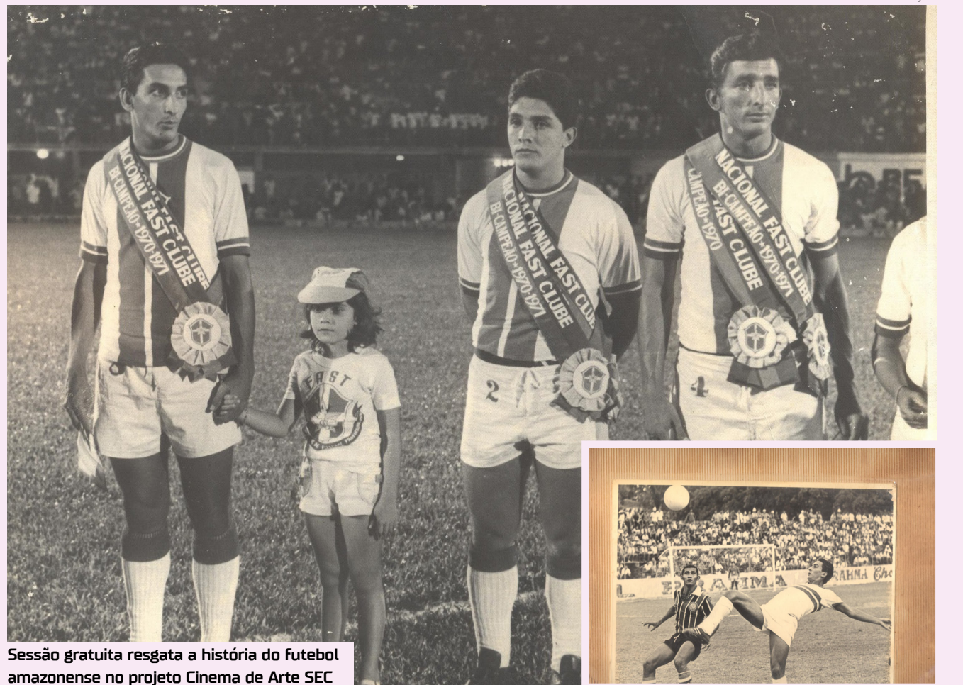
Sessão gratuita resgata a história do futebol amazonense no projeto Cinema de Arte SEC

A exibição faz parte da programação contínua do "Cinema de Arte SEC", que busca ampliar o acesso do público a produções audiovisuais e valorizar histórias que contribuem para a memória cultural do Amazonas.