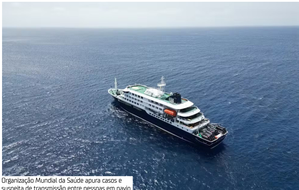
Organização Mundial da Saúde apura casos e suspeita de transmissão entre pessoas em navio

A Organização Mundial da Saúde (OMS) afirmou que investiga indícios de possível transmissão de hantavírus entre pessoas a bordo de um cruzeiro ancorado em Cabo Verde. Até o momento, três passageiros morreram em decorrência da doença.