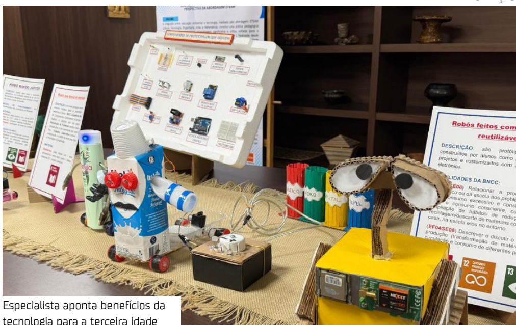
Especialista aponta benefícios da tecnologia para a terceira idade

A Prefeitura de Manaus, por meio da Secretaria Municipal de Educação (Semed), participa da Bett Brasil 2026, considerado o maior evento de tecnologia e inovação educacional da América Latina. A programação acontece entre os dias 5 e 8/5, no Expo Center Norte, em São Paulo, reunindo especialistas, gestores e instituições de ensino de todo o país.