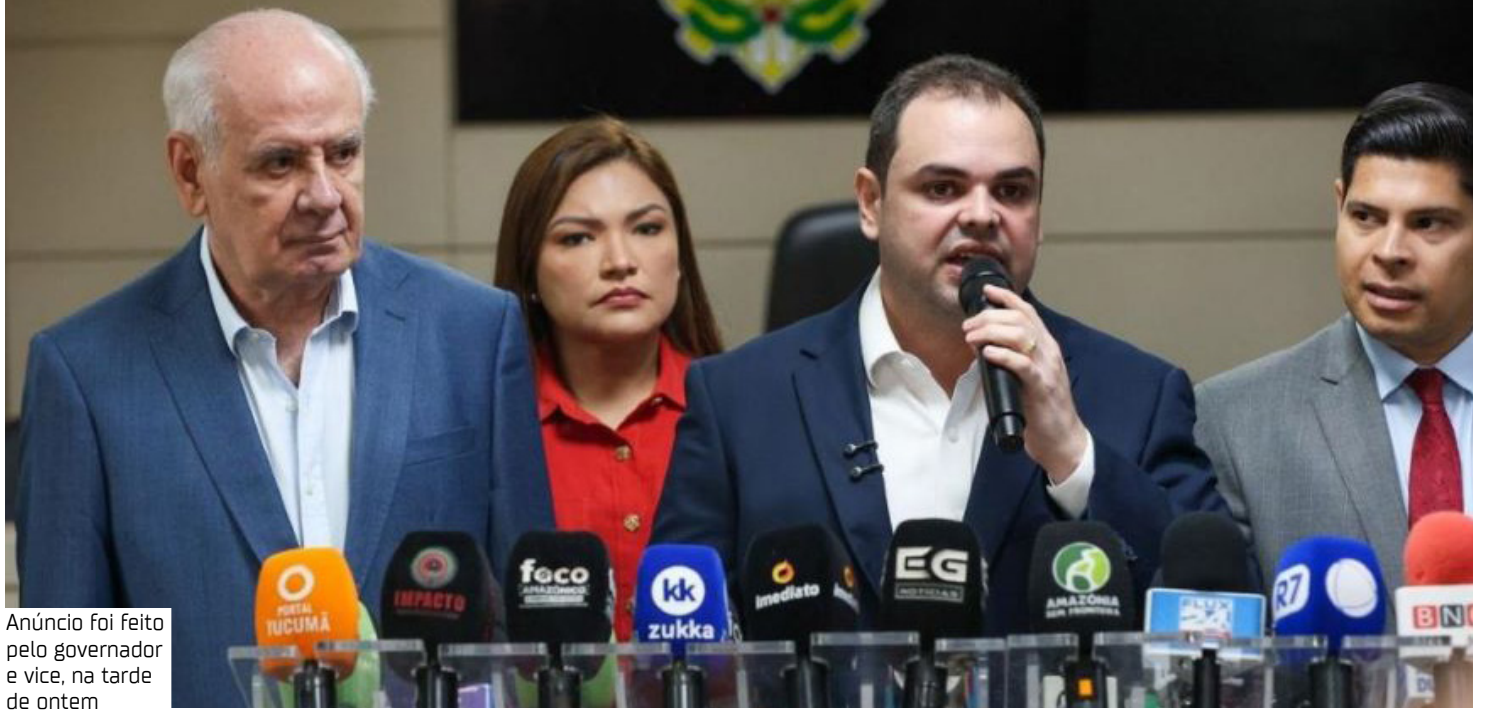
Anúncio foi feito pelo governador e vice, na tarde de ontem