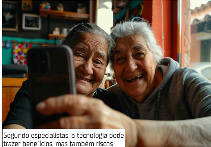
Segundo especialistas, a tecnologia pode trazer benefícios, mas também riscos

"O celular virou um 'cavalete suíço moderno'. Ele permite que o idoso se comunique, resolva questões do dia a dia e mante-