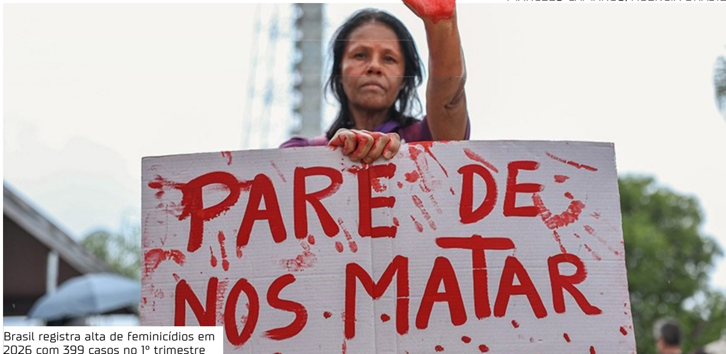
Brasil registra alta de feminicídios em 2026 com 399 casos no 1º trimestre

No entanto, pesquisadores destacam que o principal fator ainda é estrutural. O machismo persistente na sociedade segue como elemento central na motivação dos crimes.