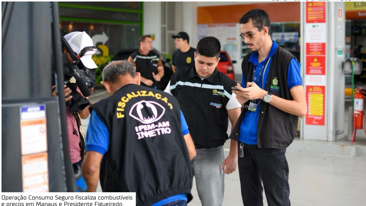
Operação Consumo Seguro fiscaliza combustíveis e preços em Manaus e Presidente Figueiredo

"A atuação integrada aumenta a eficiência das fiscalizações e amplia nossa capacidade de proteger os