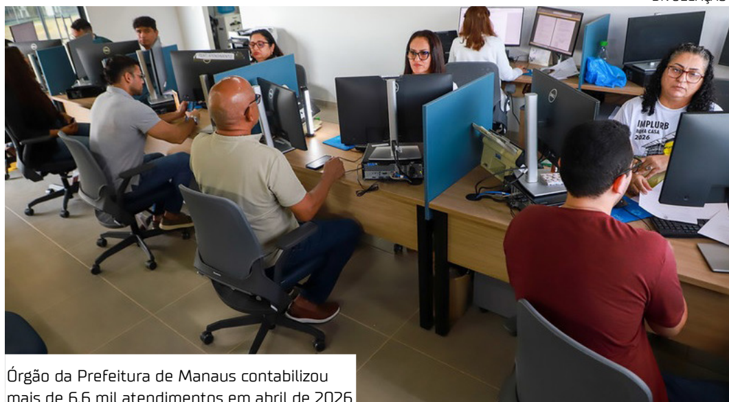
Órgão da Prefeitura de Manaus contabilizou mais de 6,6 mil atendimentos em abril de 2026

Todos os serviços e processos passam pela Gerência de Atendimento (Geat), de segunda a sexta-feira,