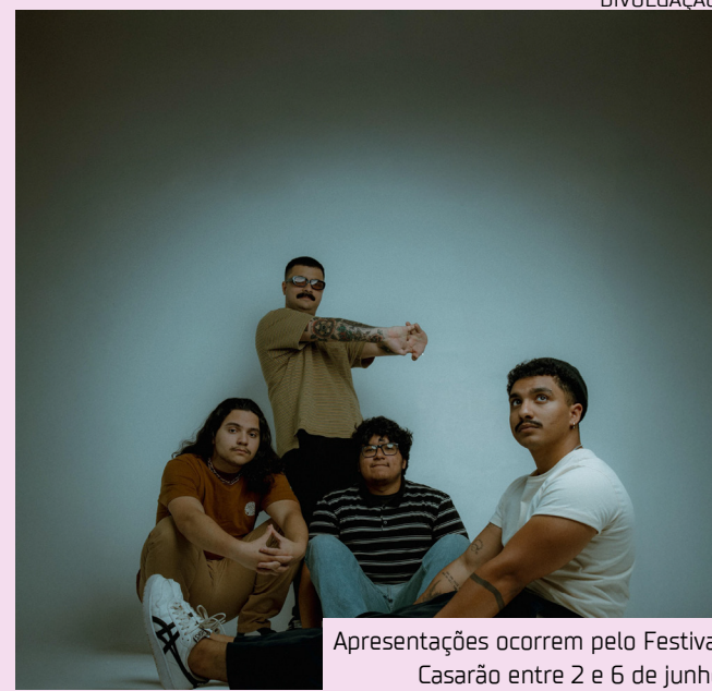
Apresentações ocorrem pelo Festival Casarão entre 2 e 6 de junho

Brasília (DF): 02 de junho de 2026 Porto Velho (RO): 04 de junho de 2026 Manaus (AM): 06 de junho de 2026