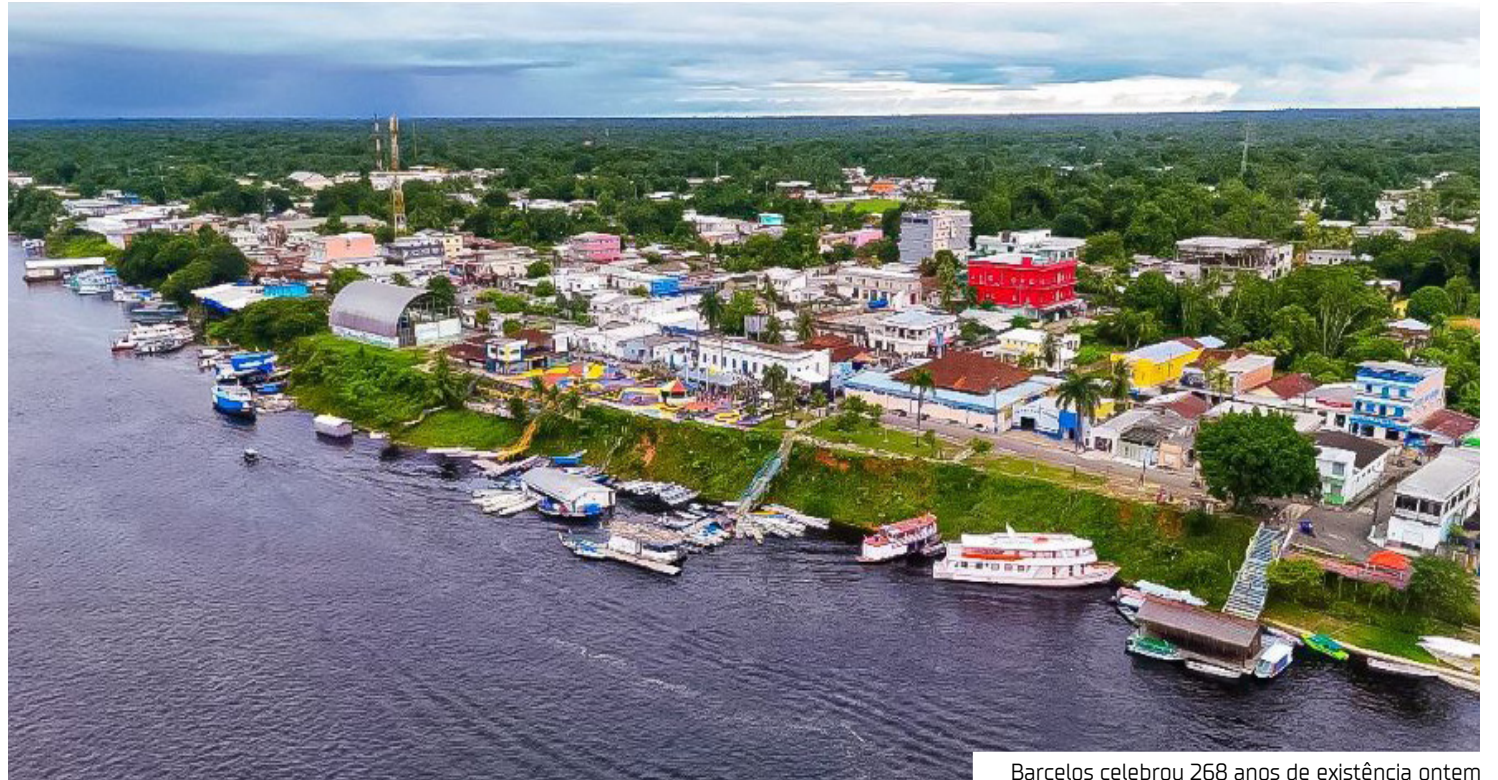
Barcelos celebrou 268 anos de existência ontem

O deputado anunciou ainda a realização de uma audiência pública na Aleam, com a participação de órgãos federais, para discutir as demarcações de terras, as condições de