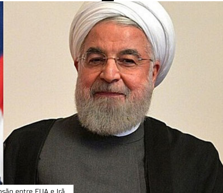
Trump e Rouhani: ao longo de 2019, disputas que aumentaram a tensão entre EUA e Irã

Estados Unidos e Irã estão próximos de firmar um acordo para encerrar o conflito no Oriente Médio. A informação foi divulgada por um alto funcionário do governo do Paquistão, que atua como mediador nas negociações entre os dois países.