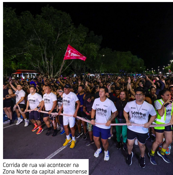
Corrida de rua vai acontecer na Zona Norte da capital amazonense

"O Corre de Quinta já tem essa força de reunir pessoas em torno da corrida, então a ideia foi potencializar isso com o aula da Smart Fit e com a estrutura que o Shopping oferece. Cada parceiro contribui de um jeito, mas tudo converge para a mesma experiência, que é colocar as pessoas em movimento e fazer desse momento algo cole-