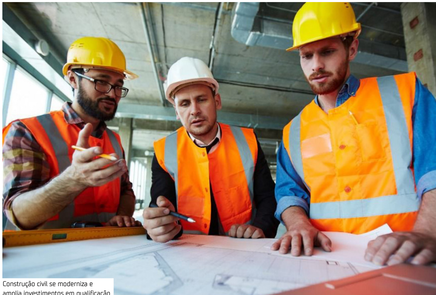
Construção civil se moderniza e amplia investimentos em qualificação

Além disso, no Amazonas, os cursos mais procurados na construção civil incluem áreas como segurança do