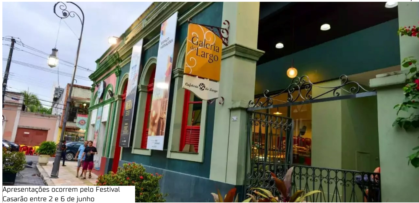
Apresentações ocorrem pelo Festival Casarão entre 2 e 6 de junho

A 10ª edição do Espaço Mediações será aberta amanhã (8), às 18h, no Centro de Artes Visuais Galeria do Largo, localizado na rua Costa Azevedo, 290, bairro Centro, Zona Sul de Manaus. Com entrada gratuita e curadoria de Cristovão Coutinho, a mostra reúne três propostas expositivas que dialogam com processos contemporâneos de criação nas artes visuais, explorando temas como corpo, identidade, espiritualidade e estruturas sociais.