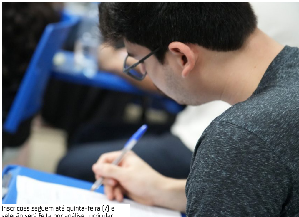
Inscrições seguem até quinta-feira (7) e seleção será feita por análise curricular