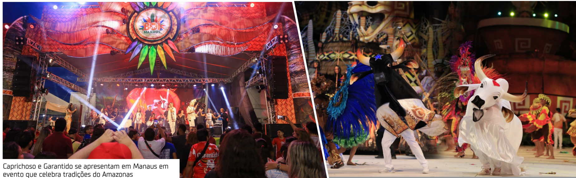
Caprichoso e Garantido se apresentam em Manaus em evento que celebra tradições do Amazonas

A iniciativa transforma o espaço em um ponto de encontro para moradores e turistas, com o objetivo de valorizar as tradições amazônicas e ampliar o acesso da população às manifestações culturais. A expectativa é de grande participação do público ao