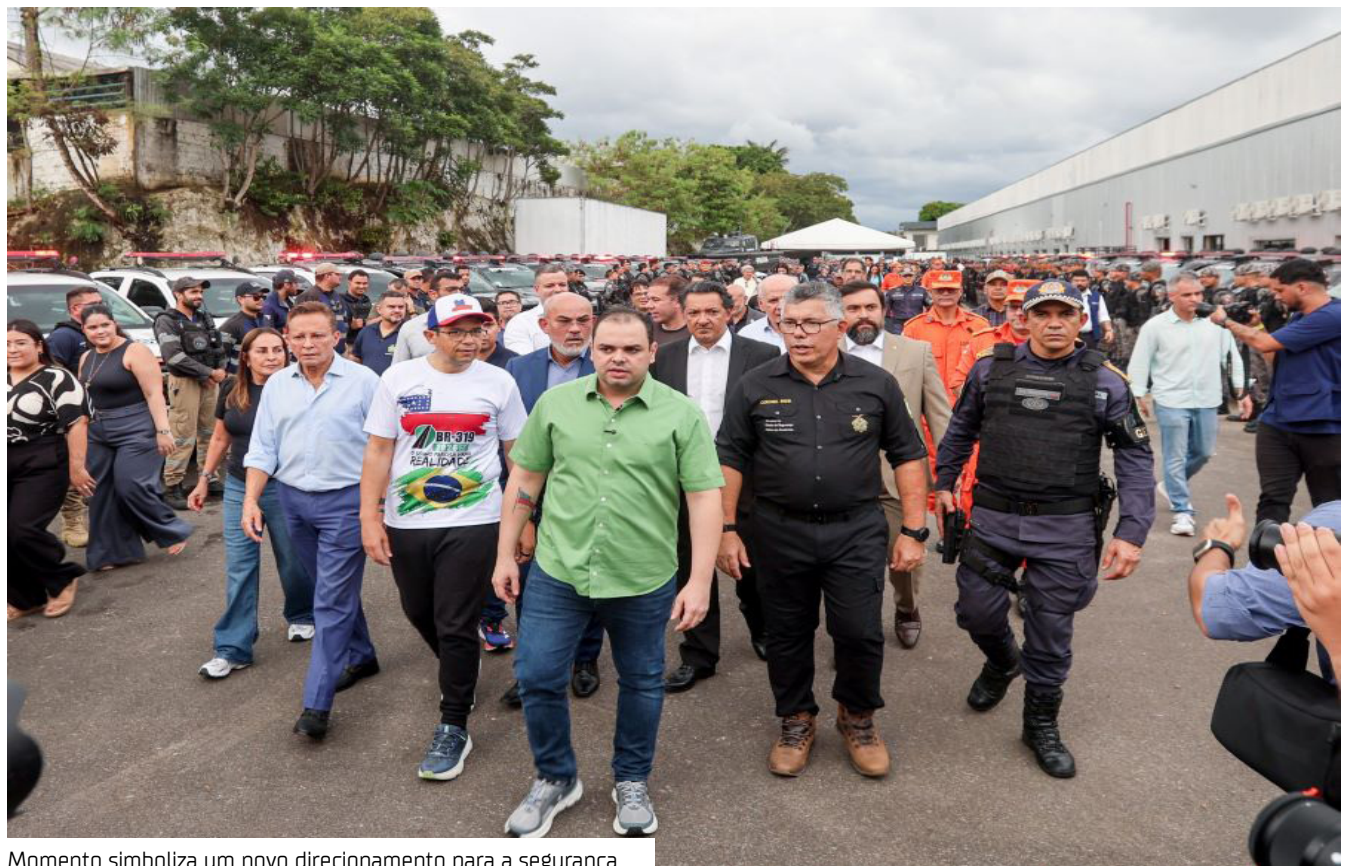
Momento simboliza um novo direcionamento para a segurança

O presidente em exercício da Assembleia Legislativa do Amazonas (Aleam), deputado Adjuto Afonso (União Brasil), participou do lançamento da Operação Segurança Presente e da entrega de novos equipamentos para as Forças de Segurança do Estado, marcando o início de uma nova fase na política de segurança pública do Amazonas, realizada pelo Governo do Estado.