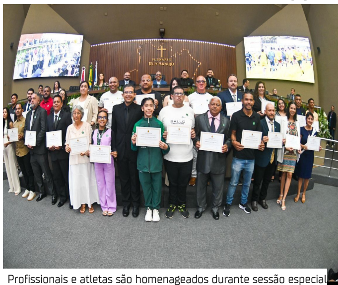
Profissionais e atletas são homenageados durante sessão especial

Criado em 2023, o curso de defesa pessoal feminina, que integra o projeto Formando Campeões, vincula-