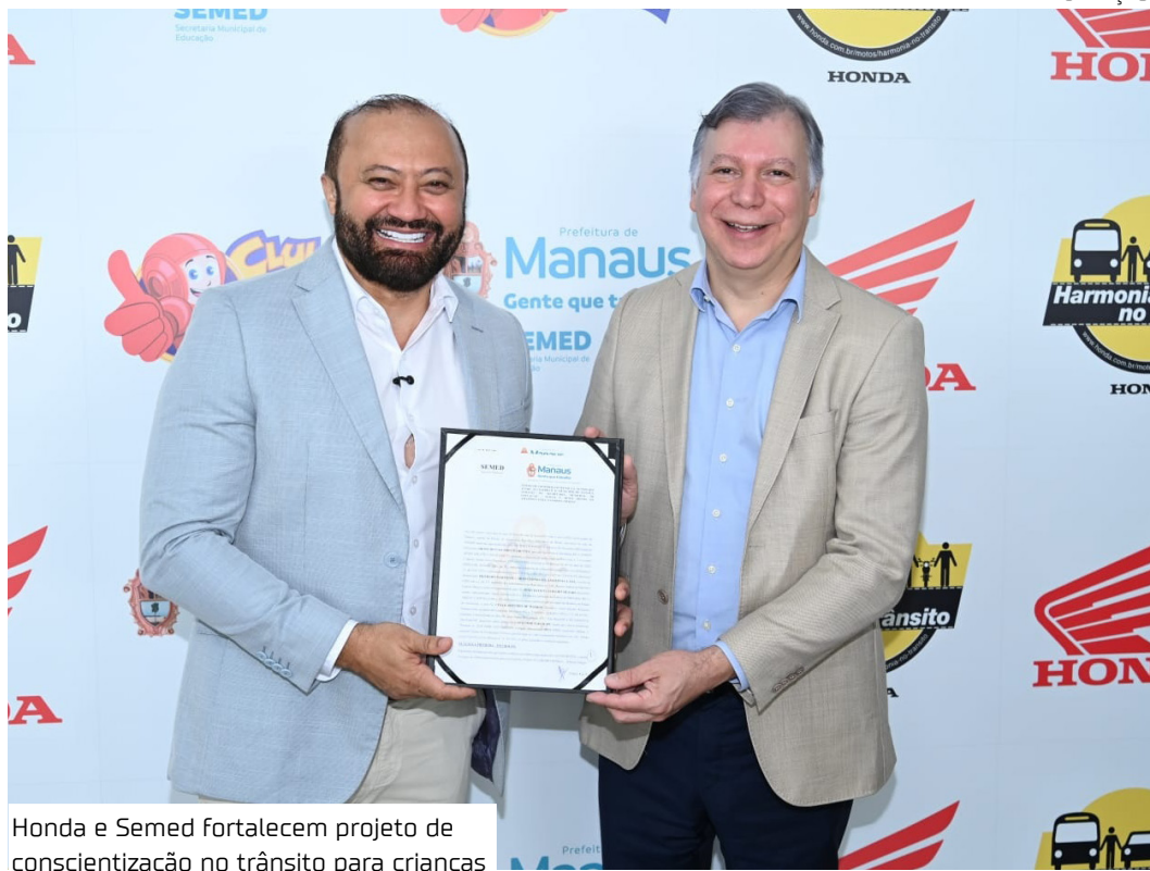
Honda e Semed fortalecem projeto de conscientização no trânsito para crianças

Presente na cidade há mais de 50 anos, a empresa mantém na cidade sua fábrica de motocicle-