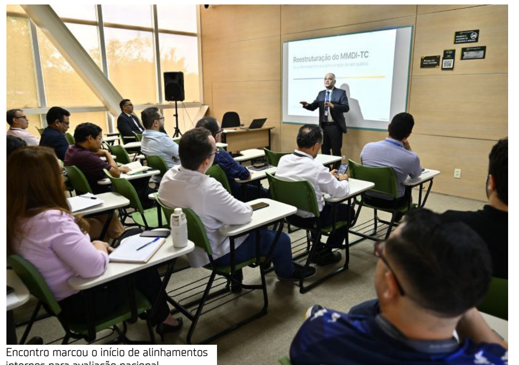
Encontro marcou o início de alinhamentos internos para avaliação nacional