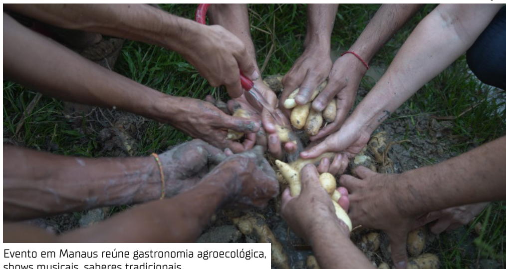
Evento em Manaus reúne gastronomia agroecológica, shows musicais, saberes tradicionais

O banquete agroecológico coletivo, a celebração da batata-ari, alimento ancestral amazônico raro, e a degustação de receitas exclusivas feitas com ingredientes da floresta serão os grandes atrativos da Festa da Floresta 2026 – Justiça Climática e Cultura Alimentar, que acontece nos dias 30 e 31 de maio, na Escola na Floresta Tera Kuno, em Manaus. A programação reúne gastronomia, saberes tradicionais, música e debates sobre soberania alimentar, preservação ambiental em uma experiência imersiva na sociobiodiversidade amazônica.