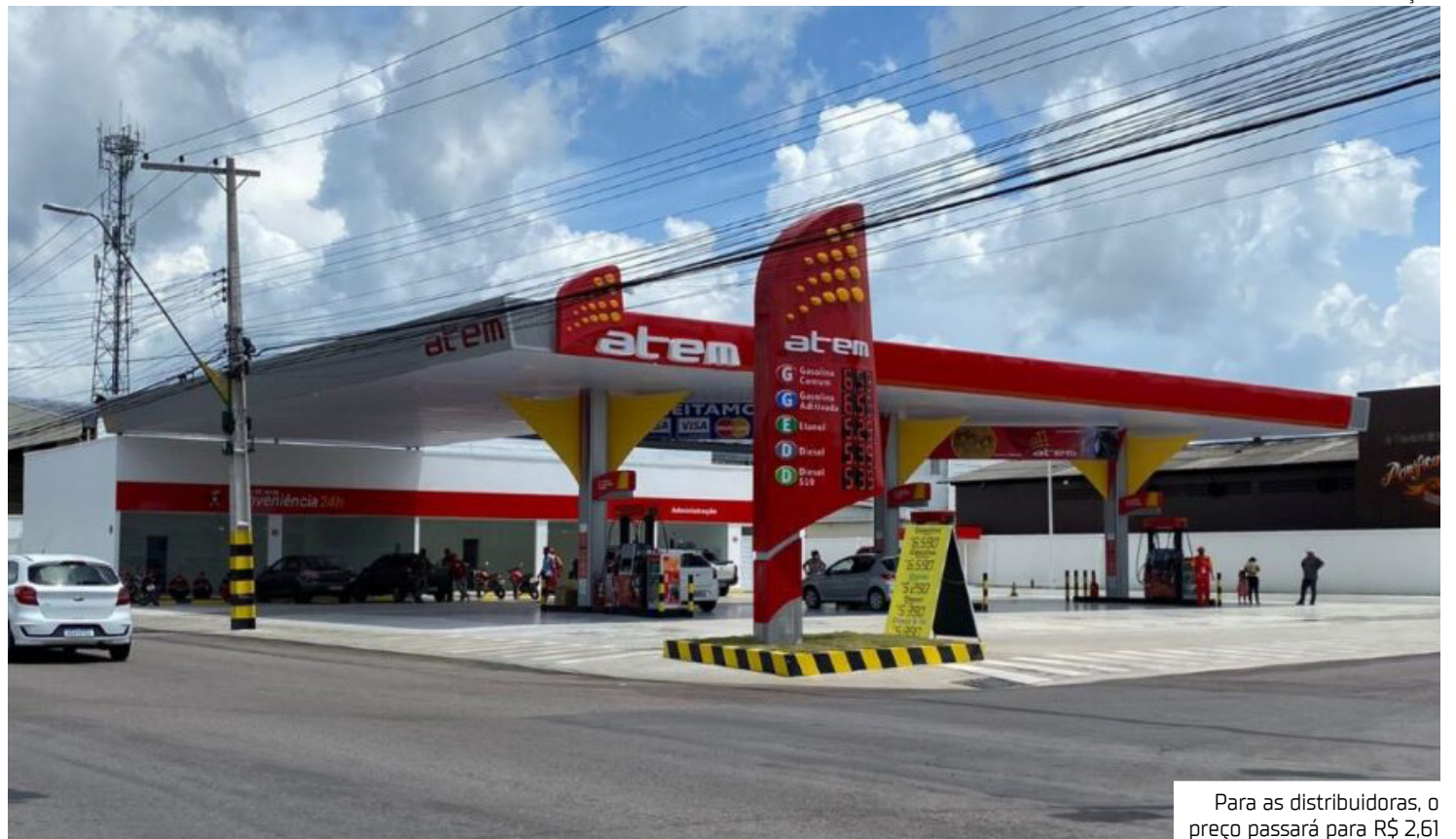
Para as distribuidoras, o preço passará para R$ 2,61

da Petrobras, Magda Chambrind, indicou, que a companhia preparava um aumento de preços da gasolina.