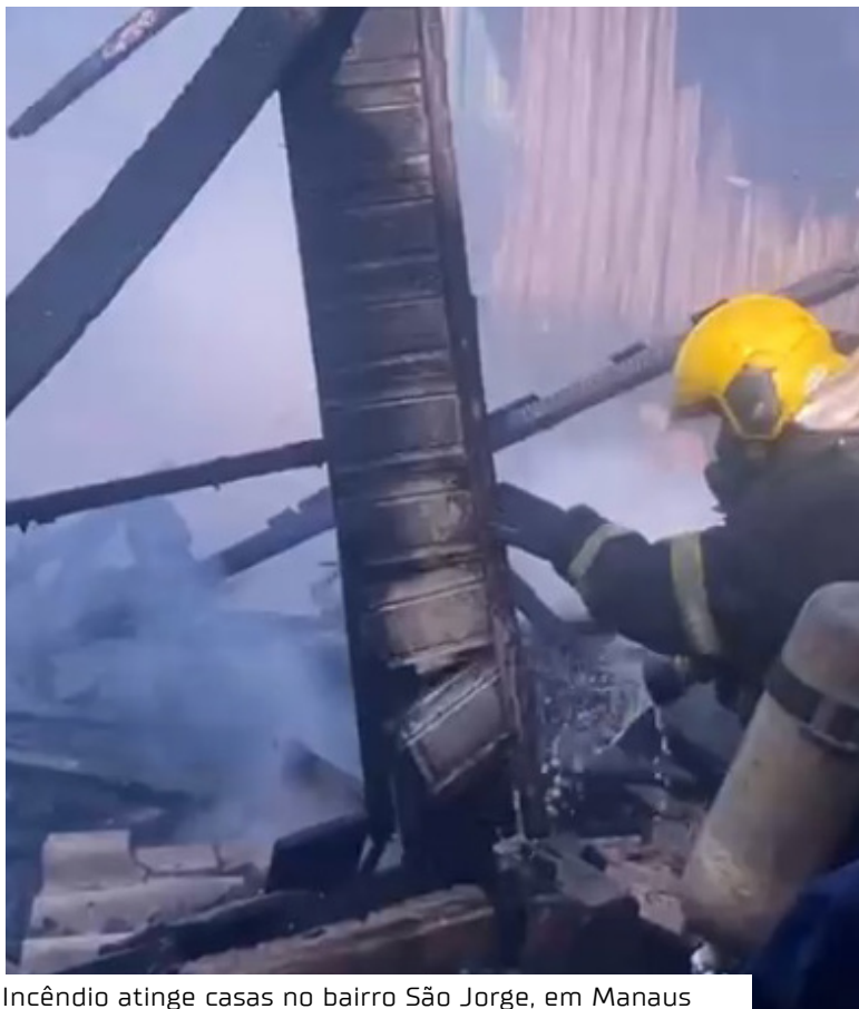
Incêndio atinge casas no bairro São Jorge, em Manaus

De acordo com informações repassadas pela