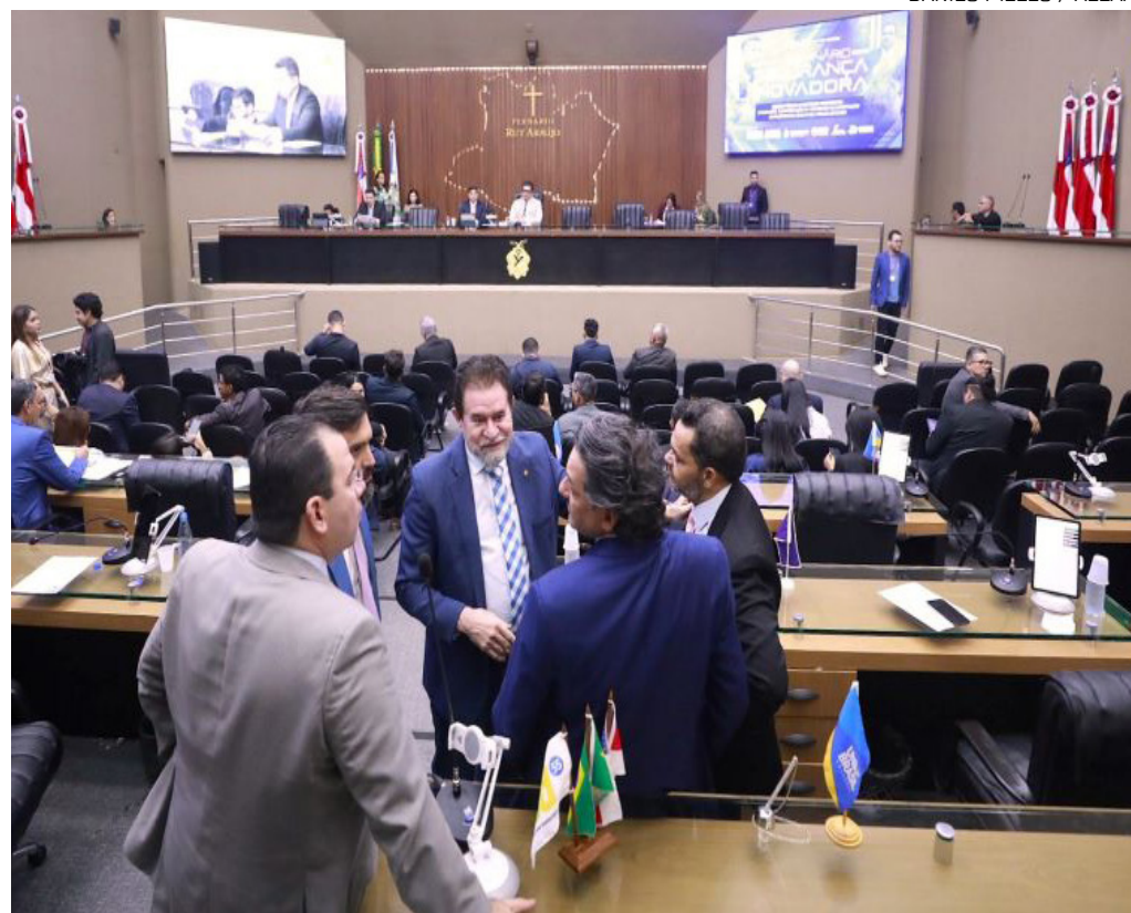
Parlamentares debateram anúncios e entregas feitas pelo presidente Lula durante a visita ao Amazonas