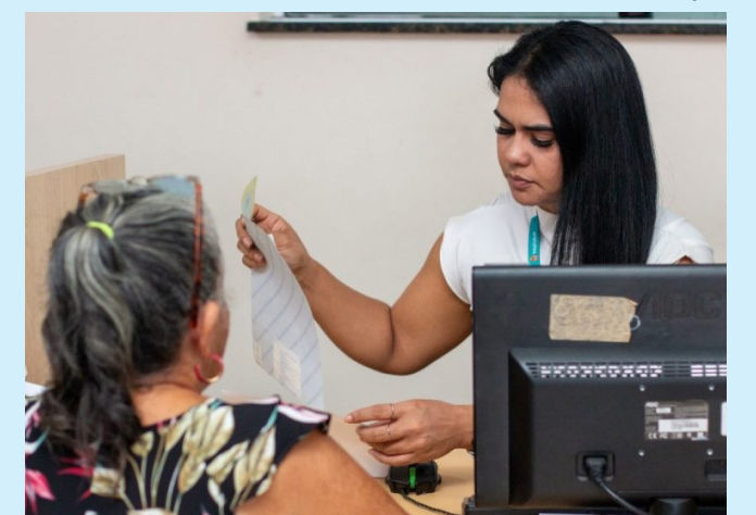
Famílias com renda de até R$ 3,2 mil poderão se inscrever no programa