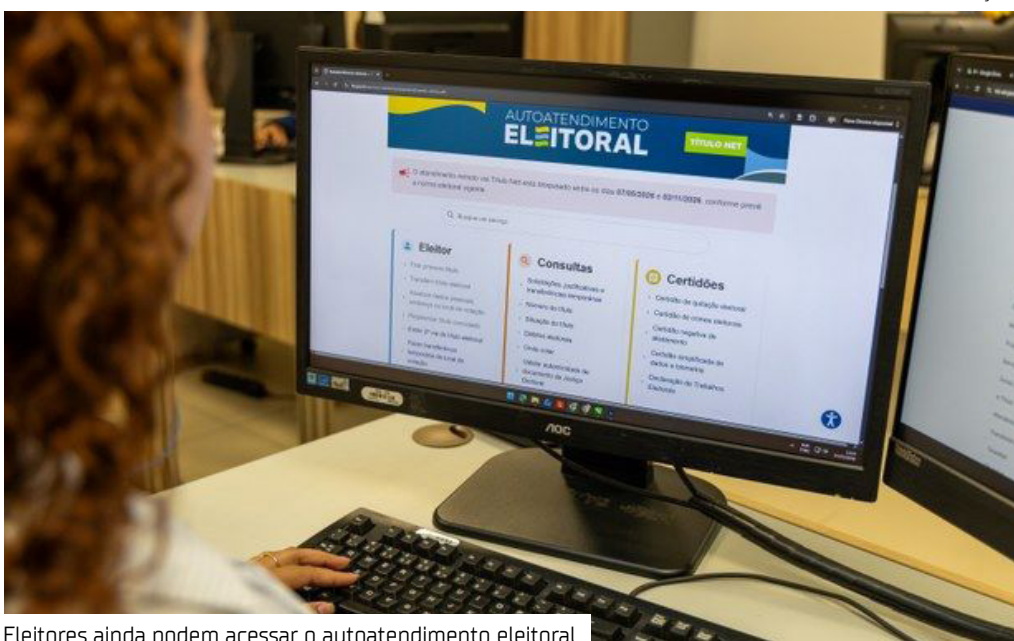
Eleitores ainda podem acessar o autoatendimento eleitoral

O Tribunal Regional Eleitoral do Amazonas (TRE-AM) informa aos eleitores que alguns serviços eleitorais permanecem disponíveis durante o período de fechamento do cadastro eleitoral, que segue até o dia 2 de novembro.