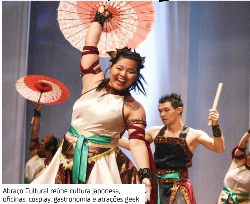
Abraço Cultural reúne cultura japonesa, oficinas, cosplay, gastronomia e atrações geek

O Abraço Cultural oferece ao público uma experiência imersiva na cultura japonesa por meio de comidas típicas, venda de artigos orientais e