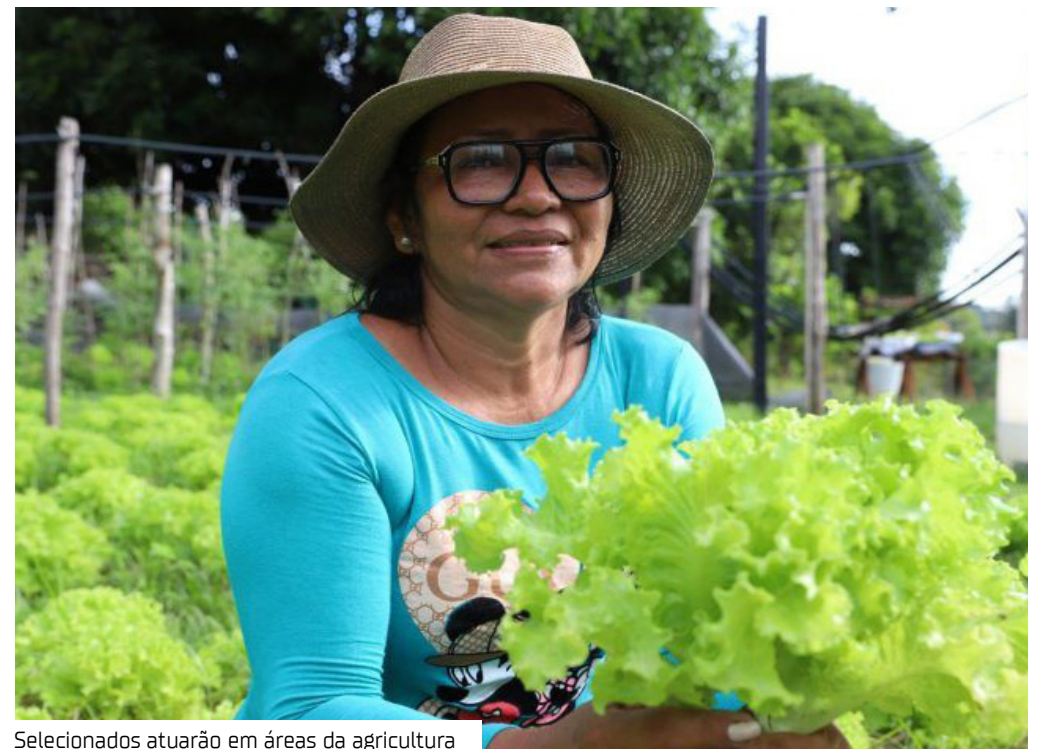
Selecionados atuarão em áreas da agricultura