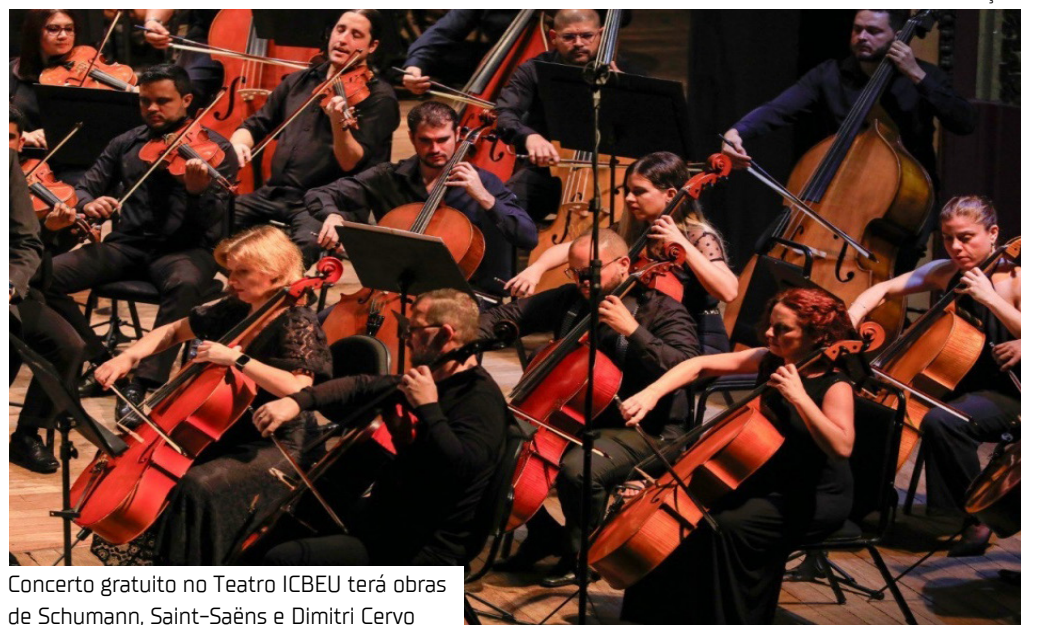
Concerto gratuito no Teatro ICBEU terá obras de Schumann, Saint-Saëns e Dimitri Cervo