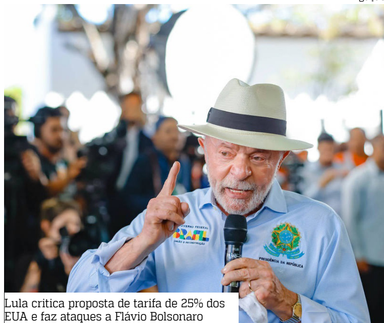
Lula critica proposta de tarifa de 25% dos EUA e faz ataques a Flávio Bolsonaro

Na mesma terça-feira, o senador Flávio Bolsonaro (PL-RJ) afirmou que solicitou “expressamente” ao governo dos Estados Unidos que não aplique tarifas contra empresas brasileiras. A declaração ocorreu em meio à repercussão das falas do presidente Lula.