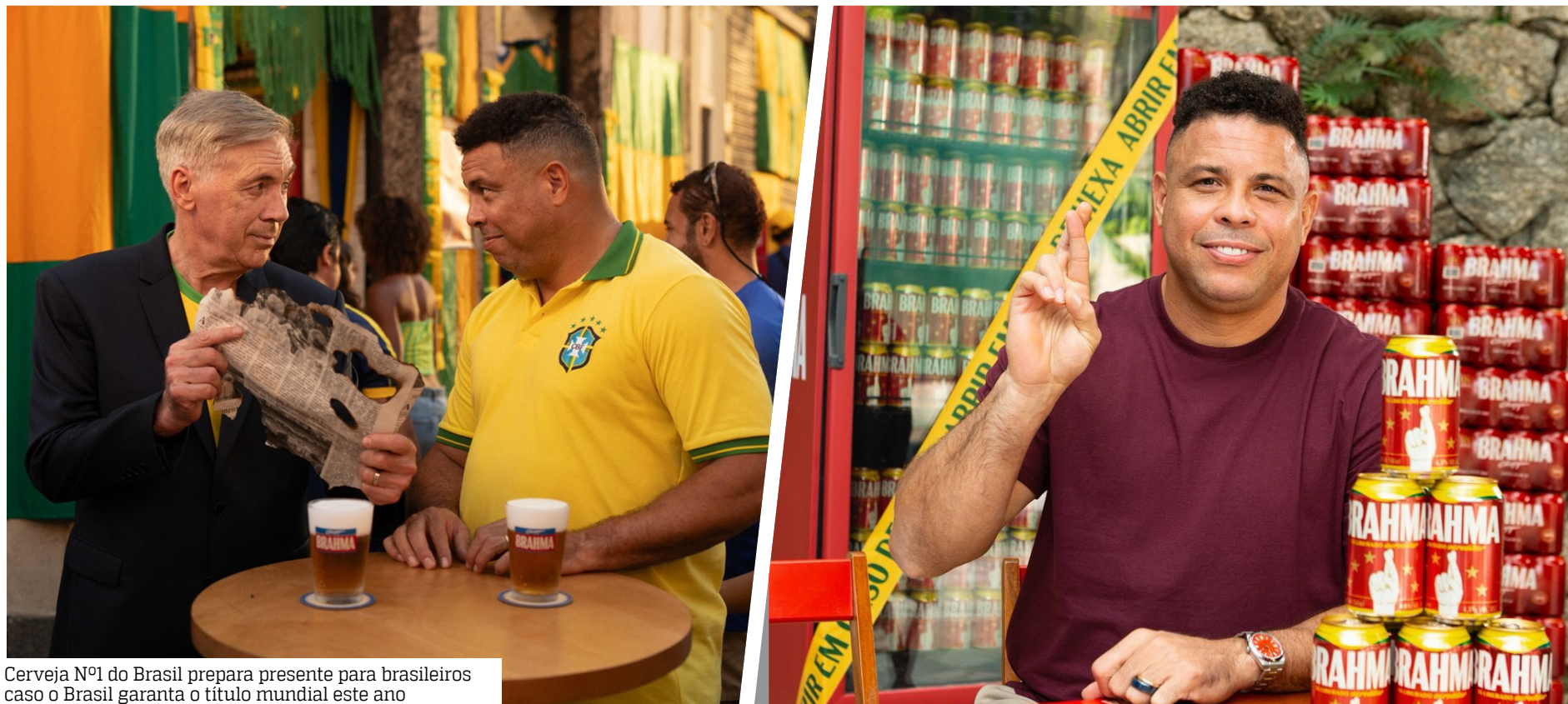
Cerveja Nº1 do Brasil prepara presente para brasileiros caso o Brasil garanta o título mundial este ano

Mais de duas décadas se passaram desde o último título mundial da Seleção Brasileira. Desde 2002, milhões de brasileiros cresceram sem ver o país conquistar uma Copa do Mundo. Além disso, essa geração nunca participou das tradicionais festas nas ruas pintadas de verde e amarelo nem comemorou um título mundial ao lado de amigos e familiares.