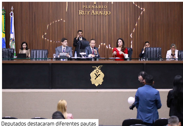
Deputados destacaram diferentes pautas

Durante a Sessão Ordinária desta terça-feira (2/6), no Plenário Ruy Araújo, os deputados da Assembleia Legislativa do Amazonas (Aleam) debateram sobre enfrentamento à violência contra mulheres e crianças, investimentos nos municípios do interior e melhorias em comunidades rurais.