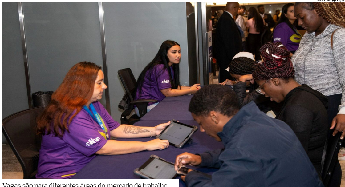
Vagas são para diferentes áreas do mercado de trabalho

outras oportunidades, podendo também montar um perfil no Portal CIEE, basta acessar ciee.online (https://portal.ciee.org.br/) . O cadastro é gratuito e é importante sempre manter os dados pessoais atualizados, pois é dessa forma que a empresa e o CIEE fazem contato