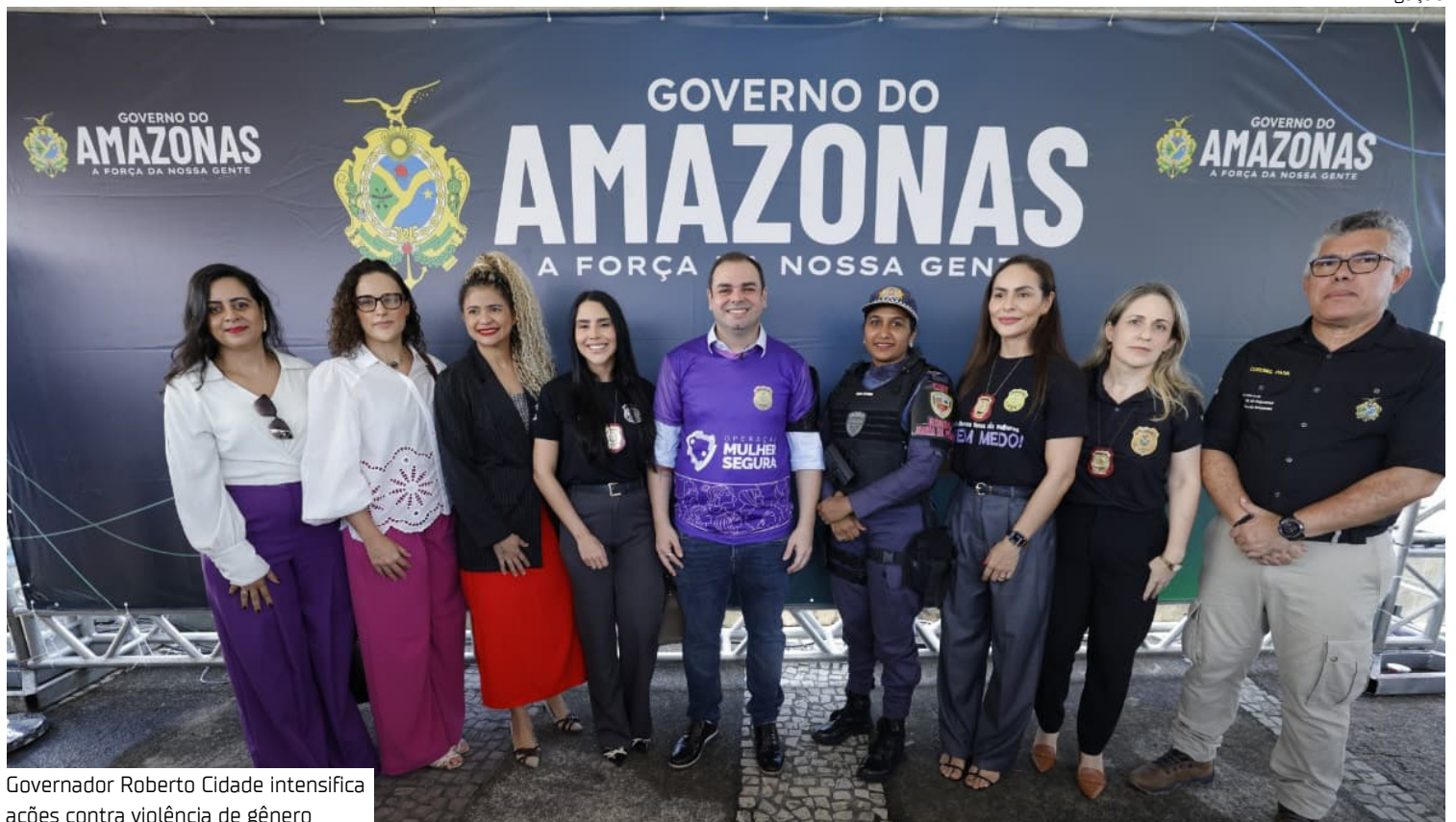
Governador Roberto Cidade intensifica ações contra violência de gênero

efetivos das polícias Militar e Civil, incluindo as três Delegacias Especializadas em Crimes contra a Mulher (DECCMs), sendo duas em funcionamento 24 horas, e a Ronda Maria da Penha, que atuarão de forma integrada em ações preventivas, ostensivas e repressivas em todas as regiões do estado.