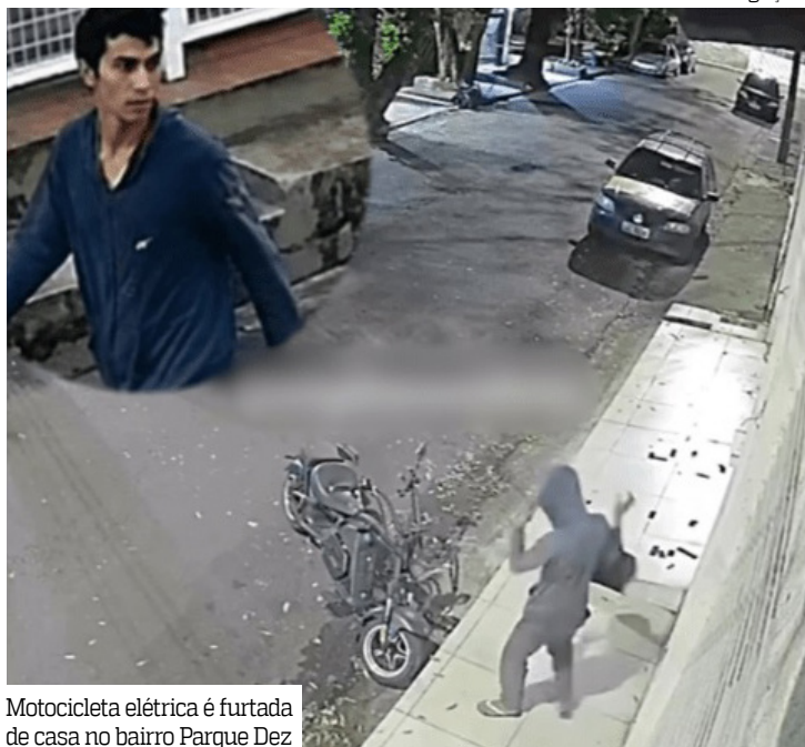
Motocicleta elétrica é furtada de casa no bairro Parque Dez

Um homem ainda não identificado foi flagrado por câmeras de segurança furtando uma motocicleta elétrica da garagem de uma casa no Parque Dez, zona Centro-Sul de Manaus.