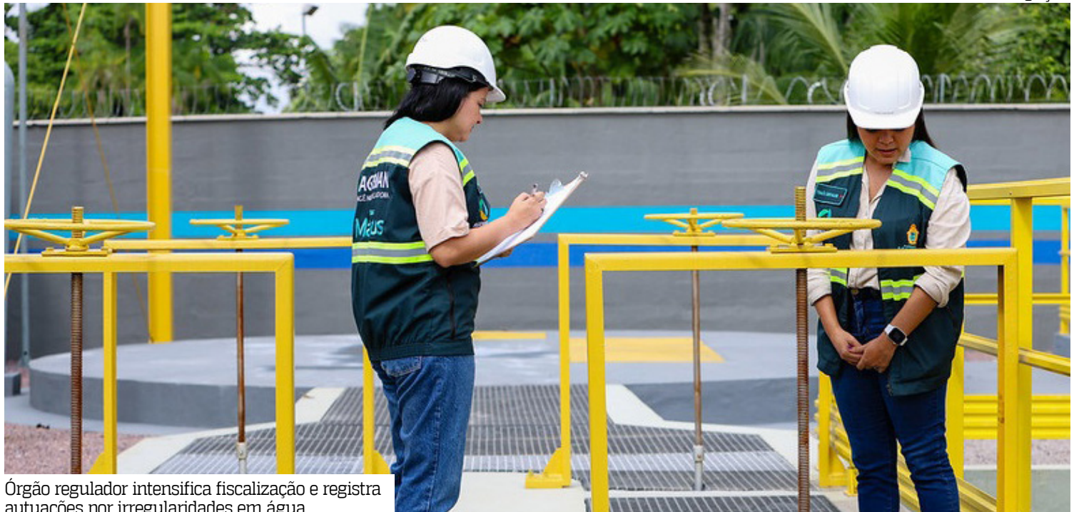
Órgão regulador intensifica fiscalização e registra autuações por irregularidades em água

De acordo com o balanço da agência reguladora, já foram lavrados 13 autos de infração neste ano. Entre os principais motivos que resultaram na aplicação das multas estão ausência de sinalização em obras executadas pela concessionária, cobrança indevida de tarifa de esgoto, problemas na recomposição asfálti-