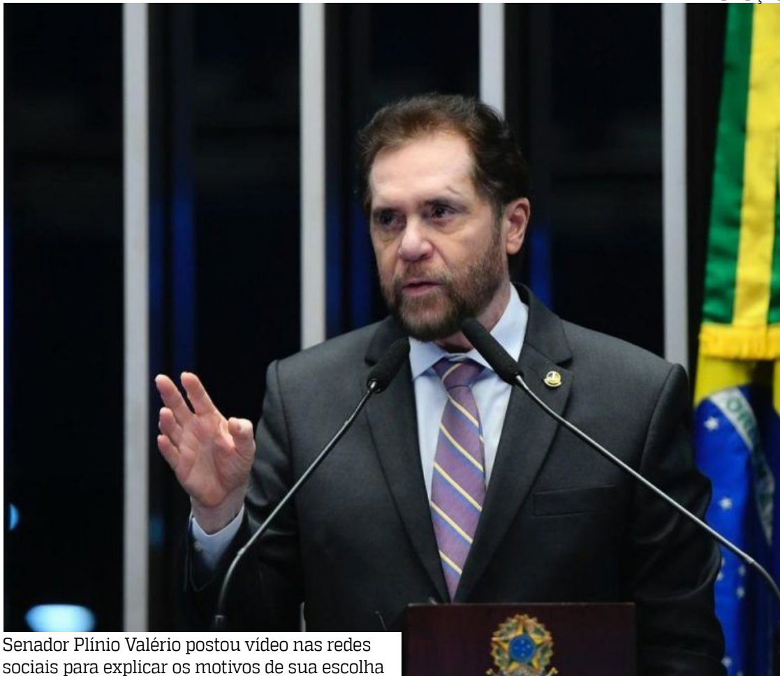
Senador Plínio Valério postou vídeo nas redes sociais para explicar os motivos de sua escolha

Em seguida, Plínio Valério citou iniciativas que, segundo ele, demonstram seu compromisso com diferentes categorias profissionais. "Fui contra a privatização da Eletrobras, fui contra a venda da refina-