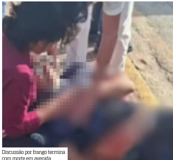
Discussão por frango termina com morte em avenida

Um funcionário de restaurante morto a facadas após uma discussão com um colega de trabalho mobilizou a Polícia Civil do Maranhão ontem (10). O crime aconteceu na avenida Carlos Cunha, no bairro Jaracaty, após um desentendimento que começou dentro de um restaurante localizado em um shopping da capital.