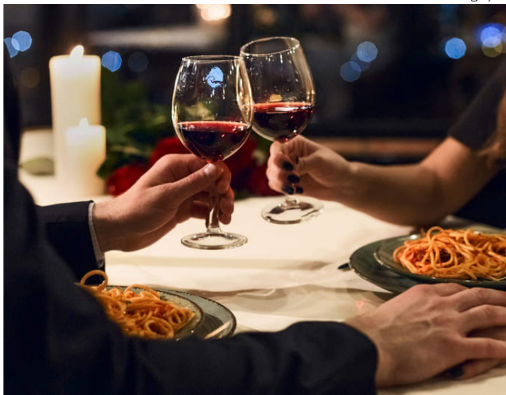
Restaurantes da capital apostam em menus exclusivos

Em meio à correria do dia a dia, muitos casais acabam deixando a programação do Dia dos Namorados para a última hora. Quando percebem, enfrentam filas, falta de vagas ou opções já esgotadas. Para evitar esses contratempos, o ideal é garantir reservas com antecedência para uma comemoração tranquila e sem frustrações.