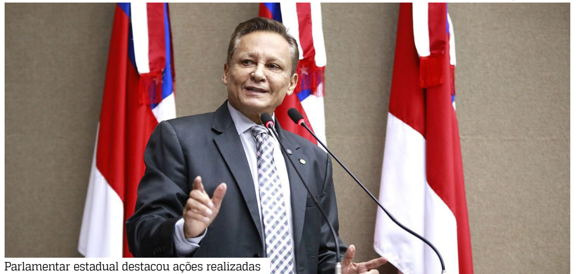
Parlamentar estadual destacou ações realizadas

O parlamentar informou ainda que pretende apre-