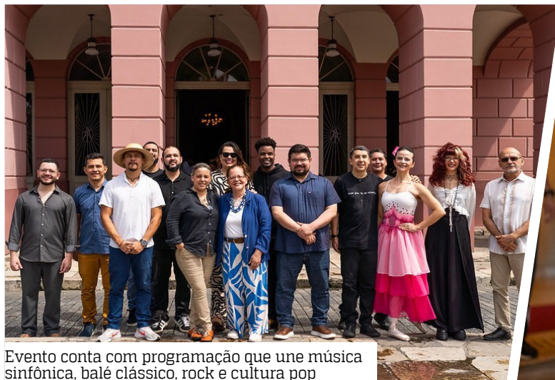
Evento conta com programação que une música sinfônica, balé clássico, rock e cultura pop

Durante duas semanas, o público poderá acompanhar apresentações que transitam entre o repertório popular brasileiro, o balé clássico, o rock sinfônico, os grandes sucessos da cultura pop e as trilhas sonoras que marcaram gerações no cinema. A programa-