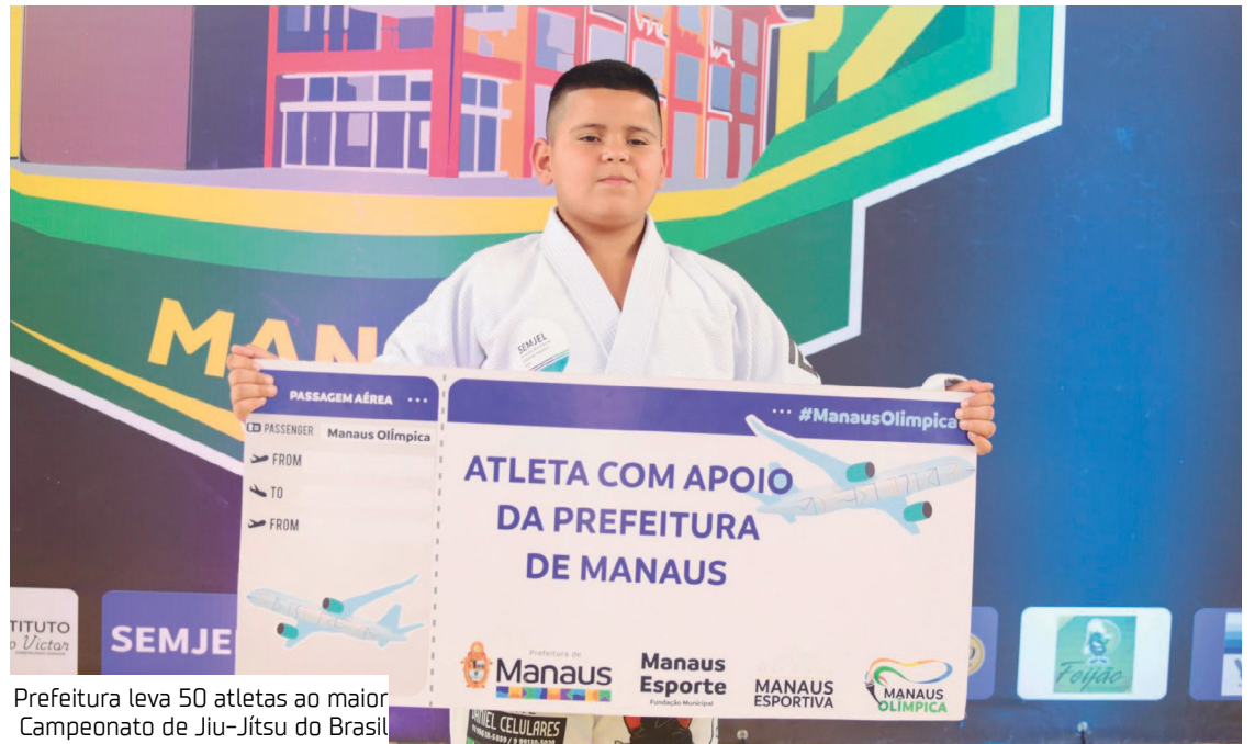
Prefeitura leva 50 atletas ao maior Campeonato de Jiu-Jítsu do Brasil

acontece após outro resultado expressivo para o esporte amazonense.