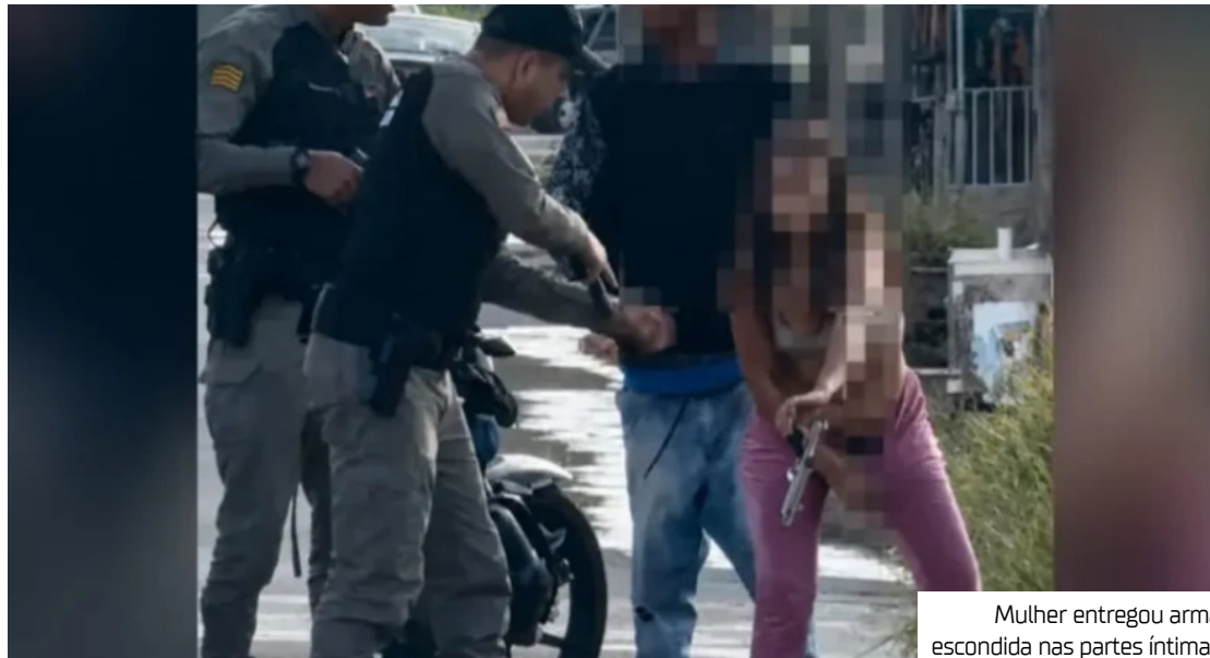
Mulher entregou arma escondida nas partes íntimas

Durante a revista, a suspeita negou portar qualquer material ilícito. No entanto, pouco depois, a