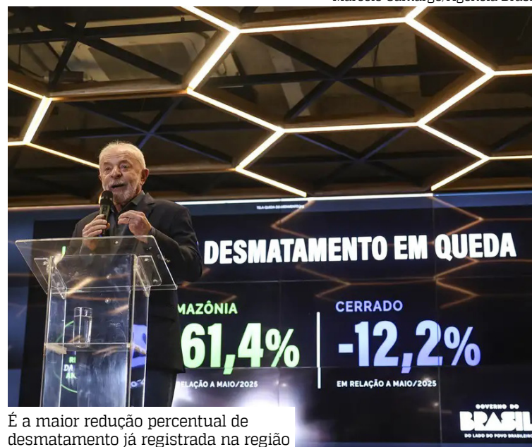
É a maior redução percentual de desmatamento já registrada na região

“Nós monitoramos isso dia a dia com uma certa aflição. Com o Ibama indo a campo fazendo os embargos remotos, o ICMBio indo a campo impedindo o desmatamento em unidades de conservação federais e também agindo em terras indígenas e assentamentos, conseguimos esse feito fundamental”, disse o ministro.