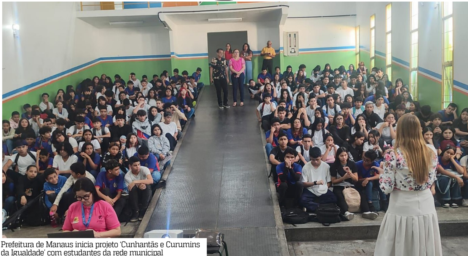
Prefeitura de Manaus inicia projeto ‘Cunhantãs e Curumins da Igualdade’ com estudantes da rede municipal