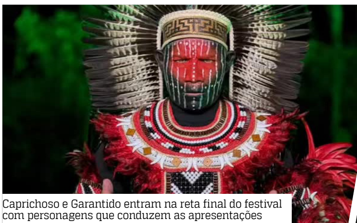
Caprichoso e Garantido entram na reta final do festival com personagens que conduzem as apresentações

O apresentador atua como anfitrião do espetáculo. Além