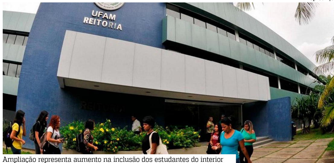
Ampliação representa aumento na inclusão dos estudantes do interior

“Sabemos da importância do PSC para milhares de estudantes amazonenses e também compreendemos os custos e os desafios logísticos enfrentados pela Ufam para realizar a aplicação das provas em um estado com dimensões como o nosso. No entanto, acredito que é possível construir uma parceria entre a universidade, o Governo e outras instituições para ampliar esse alcance. Nosso objetivo é garantir que mais jovens do interior tenham acesso ao processo seletivo sem precisar percorrer grandes distâncias, fortalecendo a inclusão e ampliando as oportunidades de ingresso no ensino superior”, destacou a parlamentar.