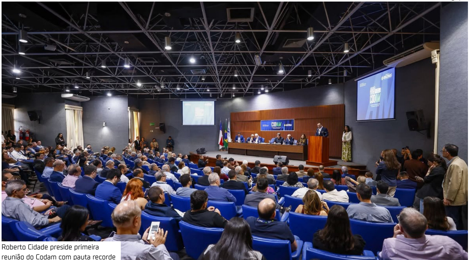
Roberto Cidade preside primeira reunião do Codam com pauta recorde

“A aprovação desses 80 projetos pelo Codam demonstra a confiança do setor produtivo no potencial do Amazonas e no ambiente favorável que estamos construindo para novos investimentos. Estamos falando de R$ 2,68 bilhões que serão injetados na nossa economia, fortalecendo a indústria, gerando oportunidades e criando mais de 4,8 mil postos de trabalho. Cada emprego criado representa mais dignidade para as famílias amazonenses e mais desenvolvimento para o nosso estado. Seguiremos trabalhando para atrair investimentos, fortalecer a nossa matriz econômica e garantir crescimento com geração de renda para a população”,