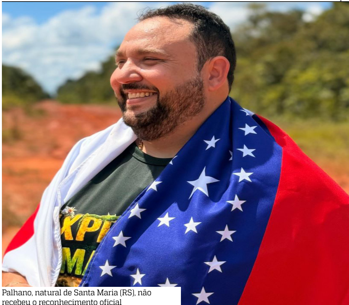
Palhano, natural de Santa Maria (RS), não recebeu o reconhecimento oficial

A base da Câmara de Presidente Figueiredo é majorita-