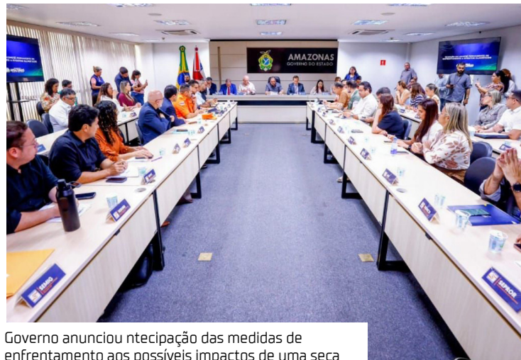
Governo anunciou antecipação das medidas de enfrentamento aos possíveis impactos de uma seca

O presidente da Assembleia Legislativa do Estado do Amazonas (Aleam), Adjuto Afonso (União Brasil), esteve na sede do Governo do Amazonas, onde acompanhou o anúncio feito pelo governador Roberto Cidade (União Brasil) sobre a antecipação das medidas de enfrentamento aos possíveis impactos de uma seca severa no estado, sob influência do fenômeno El Niño.