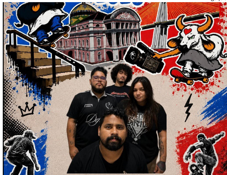
Evento reúne skatistas, bandas de rock, DJs e intervenções artísticas

No dia 21 de junho, Manaus será palco do Go Skate Day, a maior celebração da cultura skateboard no Amazonas. O evento gratuito vai reunir esporte, graffiti, música e intervenções artísticas.