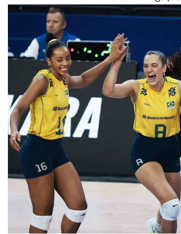
Brasil vence Bélgica na Liga de Vôlei