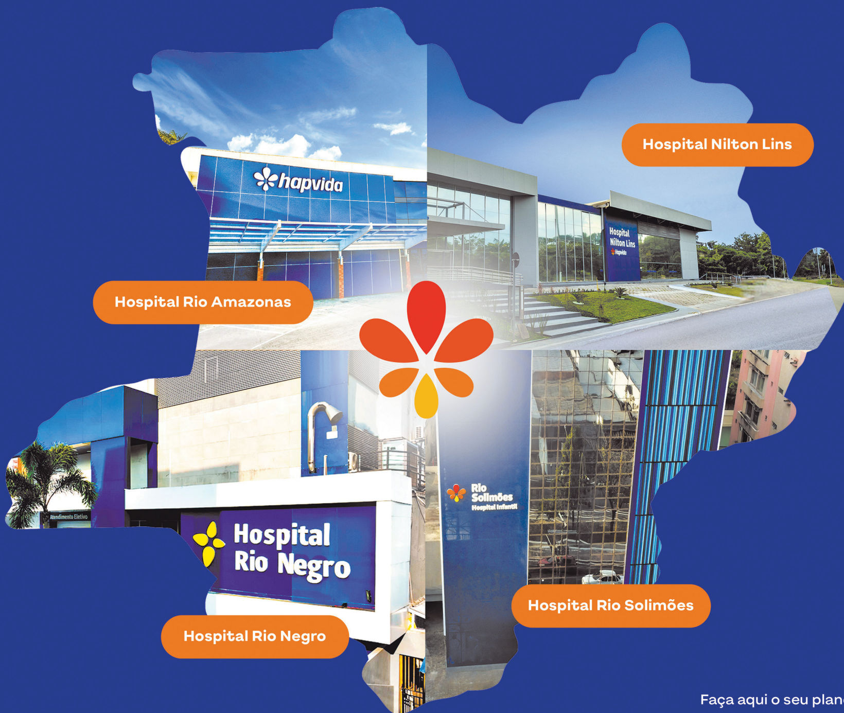
Hospital Rio Amazonas