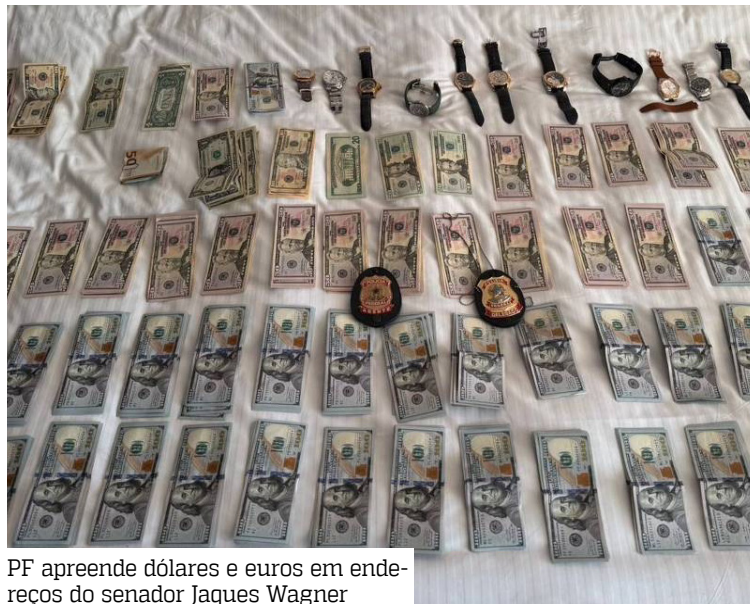
PF apreende dólares e euros em endereços do senador Jaques Wagner

A Polícia Federal investiga indícios de que o senador Jaques Wagner recebeu pagamentos ilícitos do Banco Master por meio da empresa da esposa de seu enteado. Ademais, os investigadores apuram o suposto recebimento de um apartamento em Salvador, avaliado em R$ 2,5 milhões.