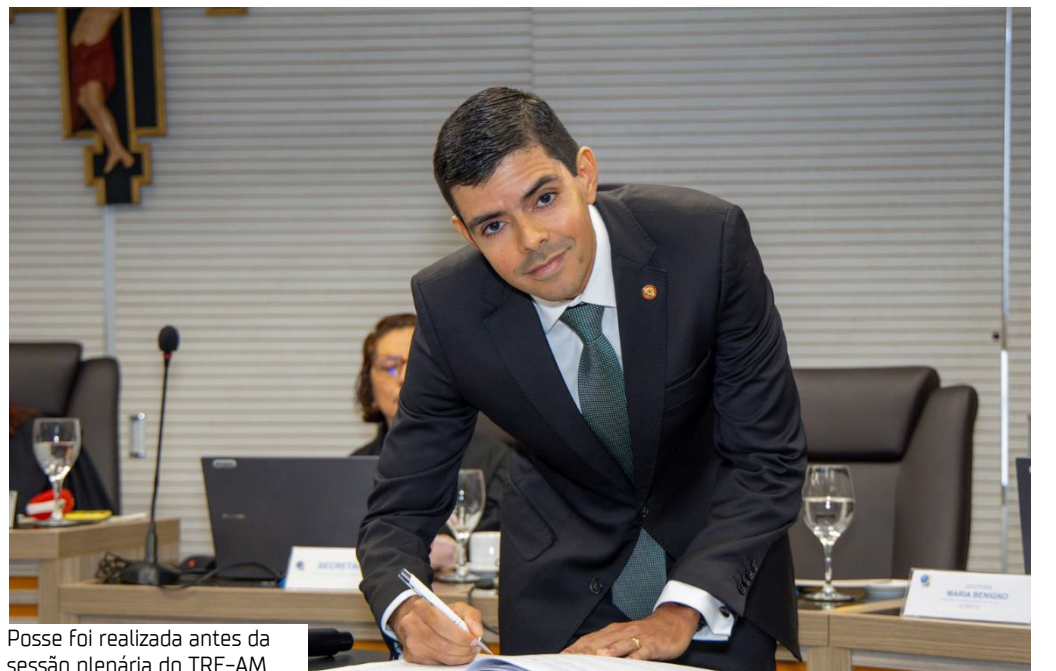
Posse foi realizada antes da sessão plenária do TRE-AM