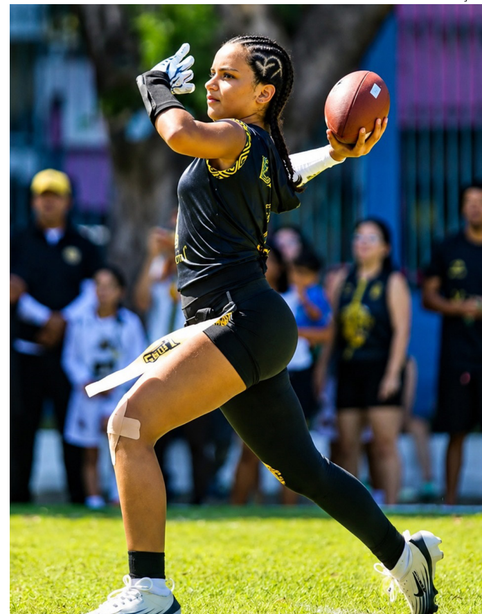
Recanto Lions conquista dois títulos na mesma competição

Além disso, a entidade já prepara uma nova competição para agosto, em parceria com a FADE. A expectativa é ampliar ainda mais o alcance e o desenvolvimento do flag football estudantil no Amazonas.