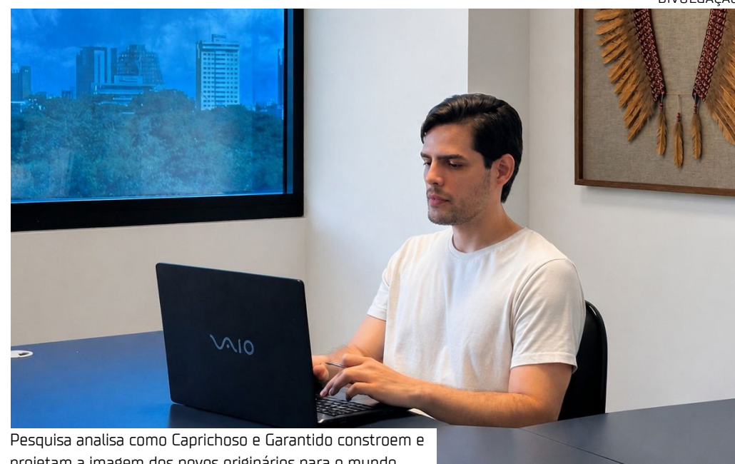
Pesquisa analisa como Caprichoso e Garantido constroem e projetam a imagem dos povos originários para o mundo

Essa vivência, somada ao olhar profissional do jornalismo e à formação acadêmica na Ufam, transformou memória, cultura e identidade em objeto de investigação científica.