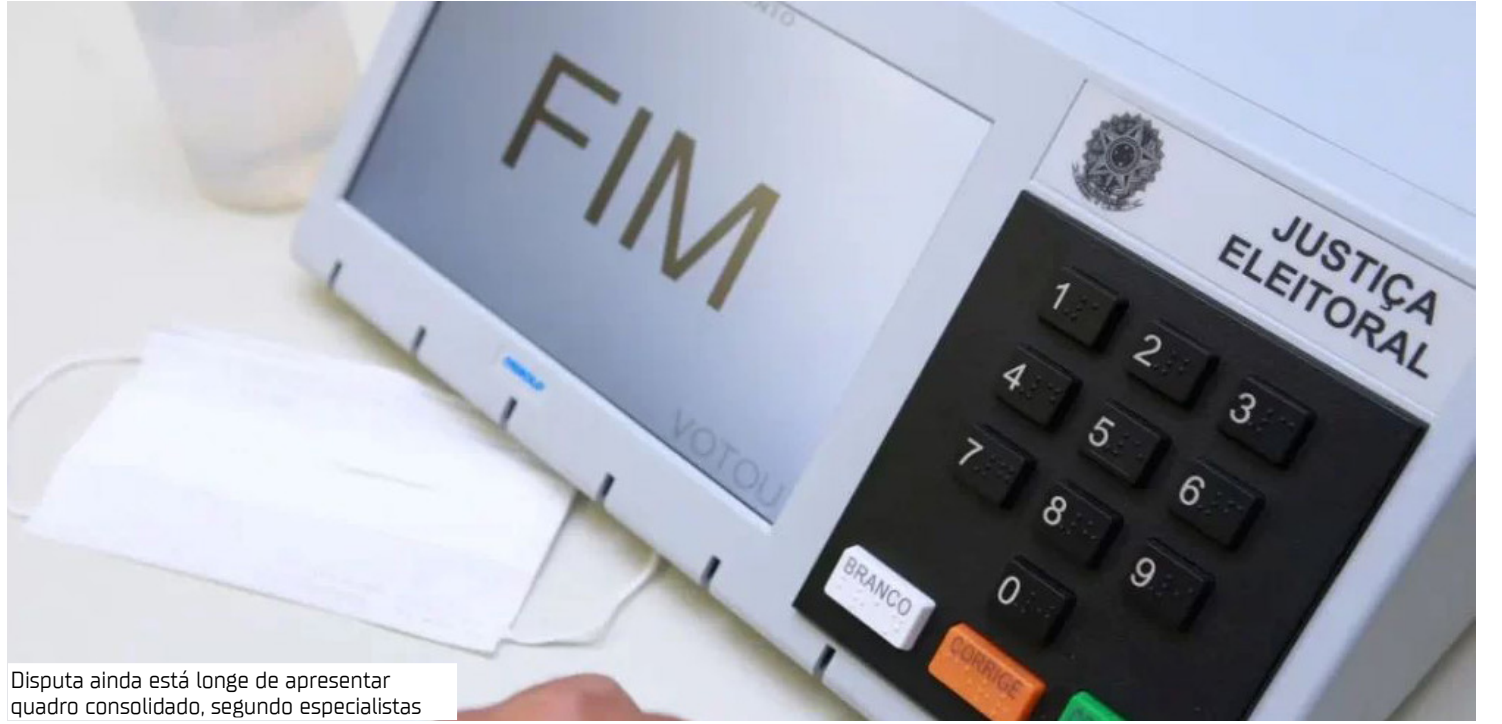
Disputa ainda está longe de apresentar quadro consolidado, segundo especialistas

"Escândalo vende nos meios de comunicação, dá audiência, mas isso, em determinado momento, esgota a paciência do eleitor comum. É ruim para o país, para a democracia e