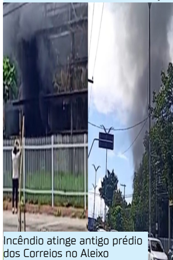
Incêndio atinge antigo prédio dos Correios no Aleixo