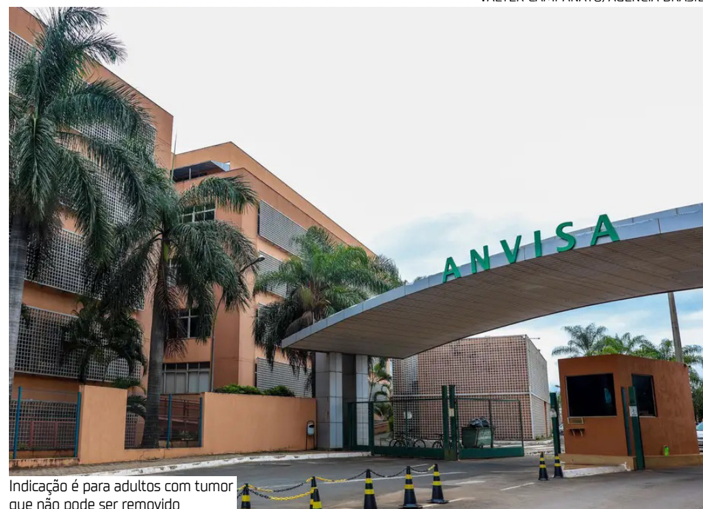
Indicação é para adultos com tumor que não pode ser removido