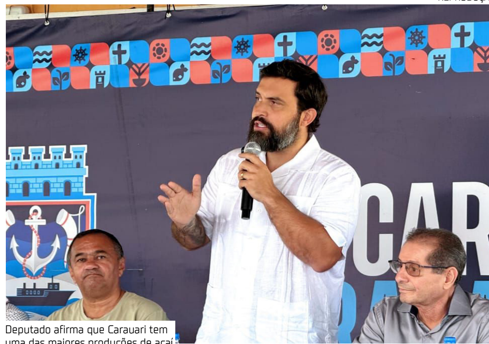
Deputado afirma que Carauari tem uma das maiores produções de açaí

Carauari entra no mapa oficial da bioeconomia amazônica. Com mais de 2,8 mil toneladas de açaí produzidas em 2025, o município recebe agora respaldo legal para fortalecer uma das principais atividades produtivas da região do Juruá. Na segunda-feira (22), a Assembleia Legislativa do Amazonas (Aleam) aprovou o Projeto de Lei do deputado Dr. George Lins (UB) que reconhece a produção de açaí em Carauari como atividade de relevante interesse social, econômico e ambiental para o Amazonas.