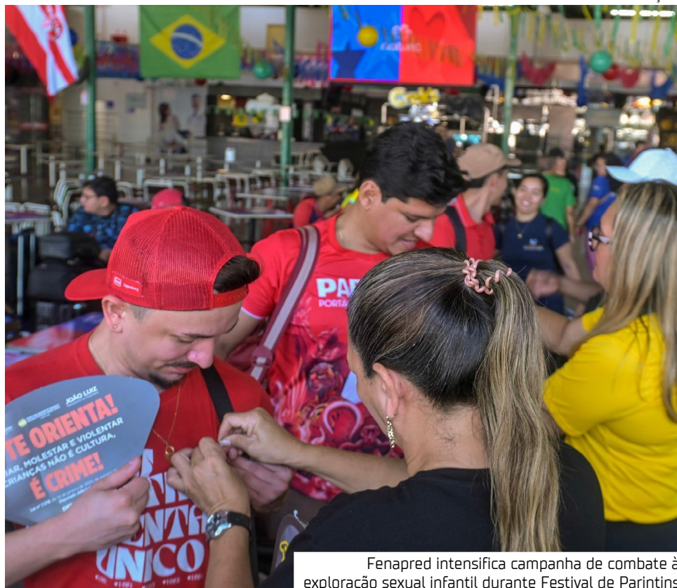
Fenapred intensifica campanha de combate à exploração sexual infantil durante Festival de Parintins