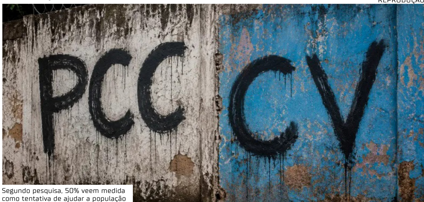
Segundo pesquisa, 50% veem medida como tentativa de ajudar a população

"um grito de socorro de uma população que teve suas vi-