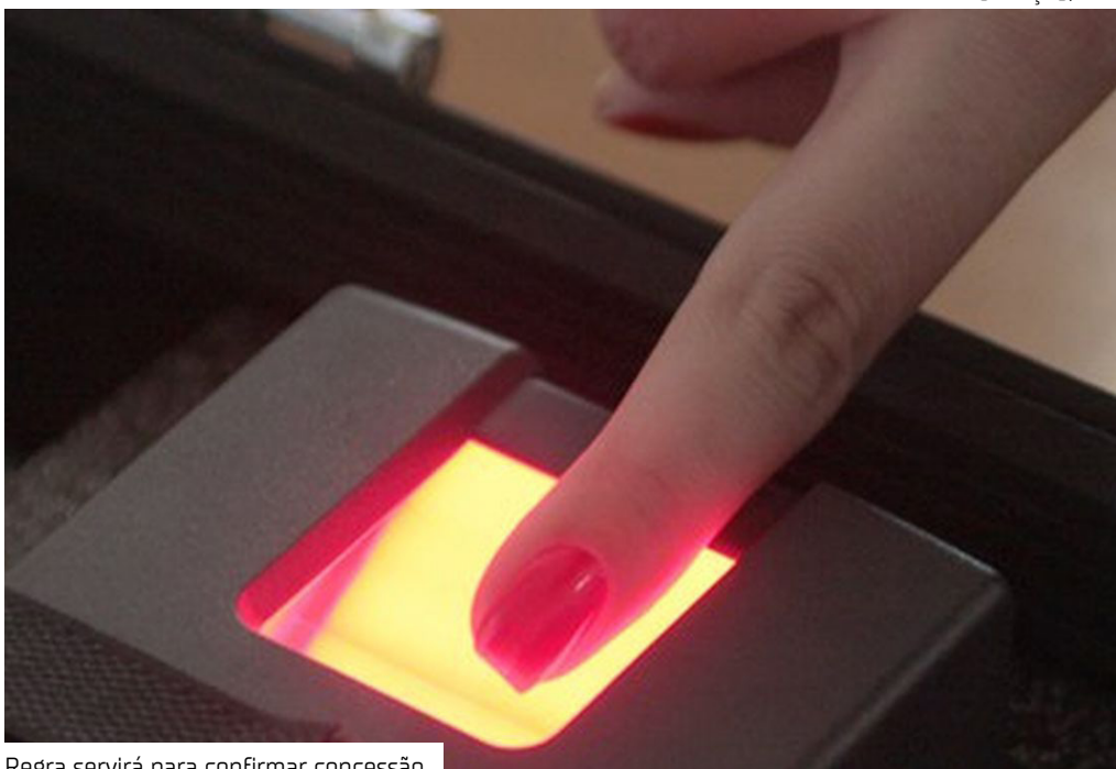
Regra servirá para confirmar concessão

O Instituto Nacional do Seguro Social (INSS) informou que vai ampliar a exigência de cadastro biométrico para a concessão de benefícios previdenciários e assistenciais, como aposentadorias, auxílios e o Benefício de Prestação Continuada (BPC/Loas).