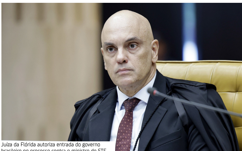
Juíza da Flórida autoriza entrada do governo brasileiro no processo contra o ministro do STF

A Justiça Federal dos Estados Unidos rejeitou, temporariamente, o pedido das empresas Rumble e Trump Media & Technology Group para declarar o ministro Alexandre de Moraes, do Supremo Tribunal Federal (STF), em revelia. As companhias, sendo a última ligada ao presidente americano Donald Trump, movem uma ação judicial contra o magistrado brasileiro em território americano.