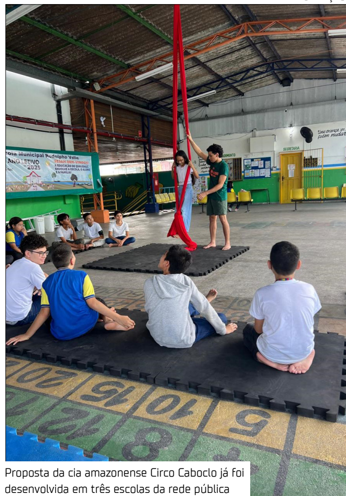
Proposta da cia amazonense Circo Caboclo já foi desenvolvida em três escolas da rede pública

"A ideia do 'Funâmbulos da Amazônia' é proporcionar uma formação artística livre, em formato de oficinas de técnicas circenses. Nós já desenvolvemos o projeto nas Escolas Municipais Rodolpho Valle, Mário Lago e Rui Barbosa Lima e agora estamos atuando na Casa Mamãe Margarida, com atividades às