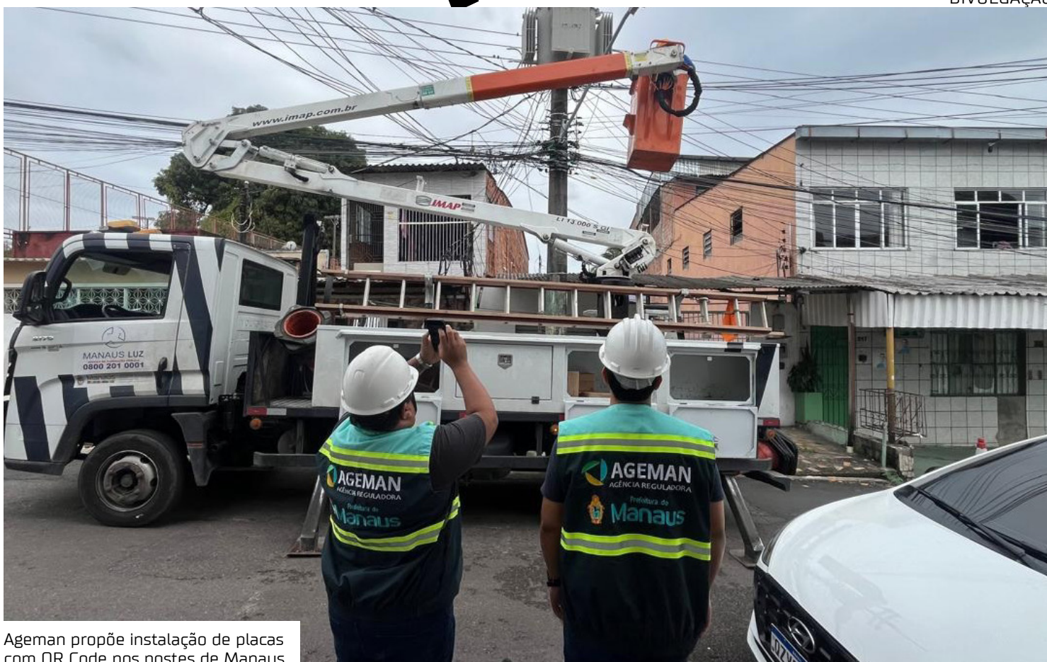
Ageman propõe instalação de placas com QR Code nos postes de Manaus

O diretor-presidente da Ageman, Ebenezer Bezerra, destacou que a utilização da tecnologia pode aproximar ainda mais a população dos serviços públicos. “A proposta do QR Code nos postes é uma solução simples, mas que pode trazer ganhos significativos para a população e para a gestão do serviço. Nossa intenção é facilitar o acesso dos usuários aos canais de atendimento e tornar mais ágil a identificação e a