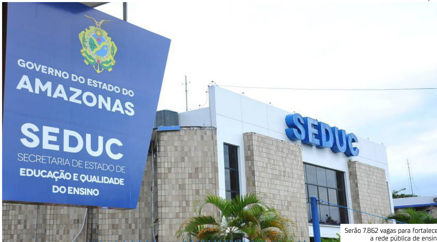
Serão 7.862 vagas para fortalecer a rede pública de ensino

"Educação é um dever de quem governa, melhorar a educação é a missão de todos nós e eu vou ter sempre carinho, amor e respeito pela educação. Nós precisamos ter muita responsabilidade com a educação do nosso estado e nós vamos avançar e deixar a nossa marca. São quase 8 mil vagas e nós já vamos trabalhar para contratar a banca e homologar ainda neste mandato. Contratar profissionais