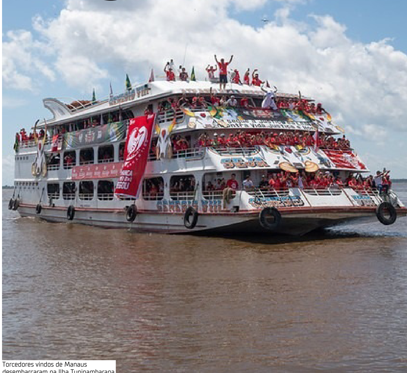
Torcedores vindos de Manaus desembarcaram na Ilha Tupinambarana

O dirigente também ressaltou o trabalho de preparação da estrutura para receber a caravana e destacou a expectativa para as apresentações na arena. "Esse espaço está sendo preparado para isso, para ser o nosso ponto de encontro. O Garantido se organizou para buscar mais um título e fazer um grande festival", completou.