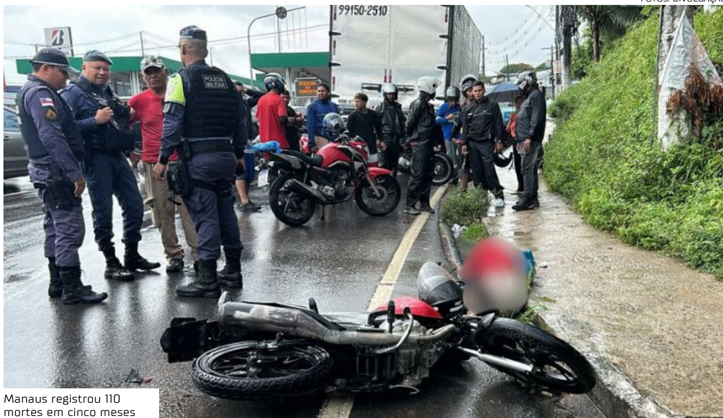
Manaus registrou 110 mortes em cinco meses