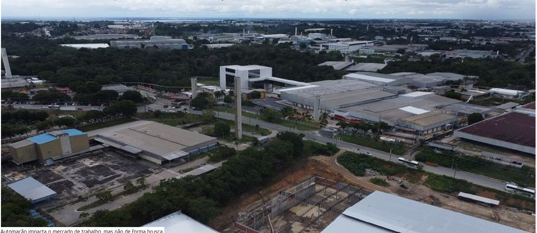
Automação impacta o mercado de trabalho, mas não de forma brusca

O empresário concorda que o principal desafio é a qualificação da mão de obra. “A convivência sinérgica entre sistemas inteligentes e o talento humano é a tônica desse processo de longo prazo, exigindo uma articulação sólida entre o setor produtivo e as instituições de ensino para preparar os profissionais para a nova realidade fabril”, disse.