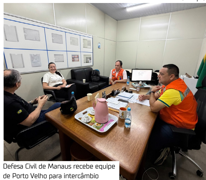
Defesa Civil de Manaus recebe equipe de Porto Velho para intercâmbio

O secretário-executivo de Proteção e Defesa Civil