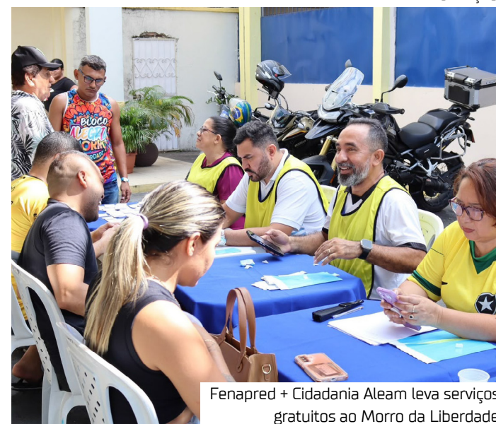
Fenapred + Cidadania Aleam leva serviços gratuitos ao Morro da Liberdade