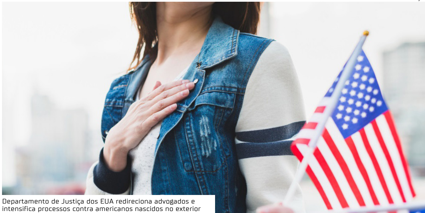
Departamento de Justiça dos EUA redireciona advogados e intensifica processos contra americanos nascidos no exterior

“Esta é uma ferramenta legal que o Congresso mantém em vigor há décadas”, disse a fonte à CNN. O funcionário acrescentou que o governo