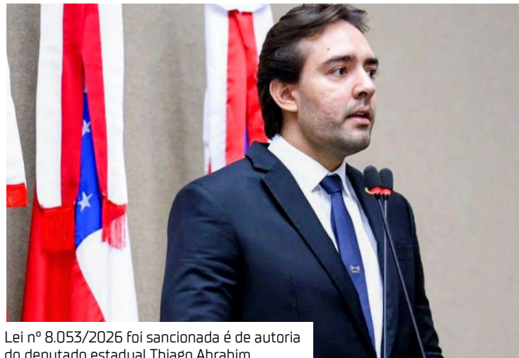
Lei nº 8.053/2026 foi sancionada é de autoria do deputado estadual Thiago Abraham

Foi sancionada a Lei nº 8.053/2026, de autoria do deputado estadual Thiago Abraham (MDB), que estabelece diretrizes para a implementação da Campanha de Conscientização Socioambiental nos portos do Estado. O foco está na preservação ambiental e no incentivo a práticas sustentáveis nas áreas portuárias por parte dos usuários dessas estruturas.