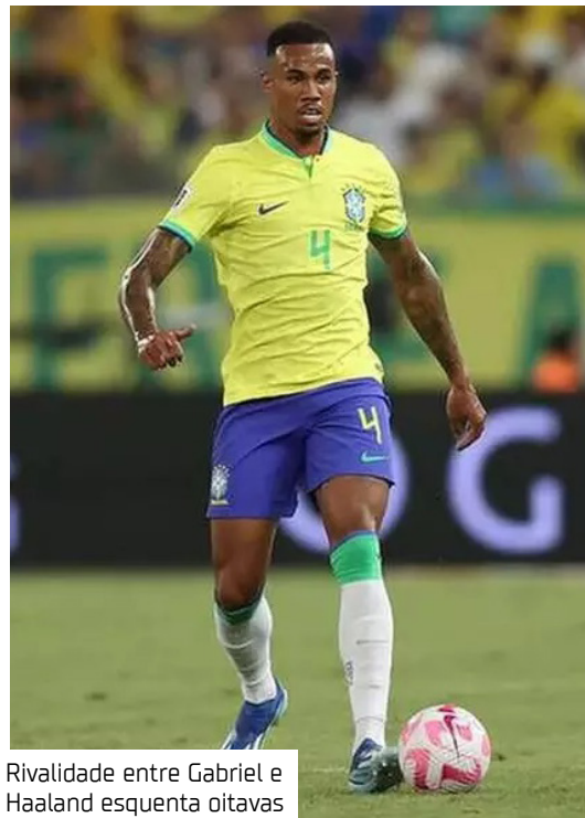
Rivalidade entre Gabriel e Haaland esquentava oitavas

Após a partida, o atacante norueguês declarou à imprensa que o defensor brasileiro deveria agradecer-lhe por não ter valorizado o