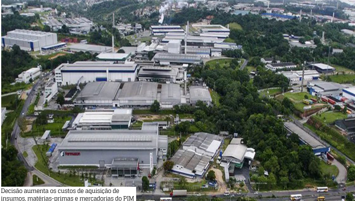
Decisão aumenta os custos de aquisição de insumos, matérias-primas e mercadorias do PIM

Priscila Caldas A decisão da Receita Federal de reduzir incentivos fiscais da Zona Franca de Manaus (ZFM) provocou reação de representantes da indústria e da bancada federal do Amazonas. A medida retira das empresas de outras regiões o direito à alíquota zero de PIS e Cofins nas vendas de produtos e insumos destinados às indústrias instaladas no polo e pode aumentar os custos da cadeia produtiva.