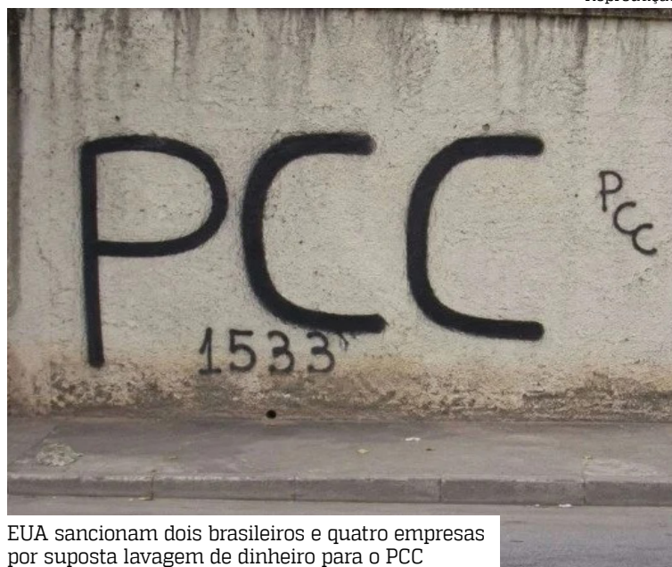
EUA sancionam dois brasileiros e quatro empresas por suposta lavagem de dinheiro para o PCC