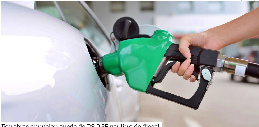
Petrobras anunciou queda de R$ 0,35 por litro do diesel