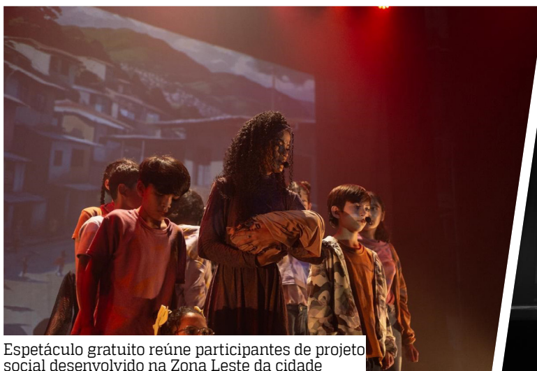
Espectáculo gratuito reúne participantes de projeto social desenvolvido na Zona Leste da cidade

Segundo a gestora do Instituto, o espetáculo de artes integradas reúne dança, teatro e música para contar histórias inspiradas na realidade de crianças, adolescentes e jovens das periferias da capital amazonense e apresen-