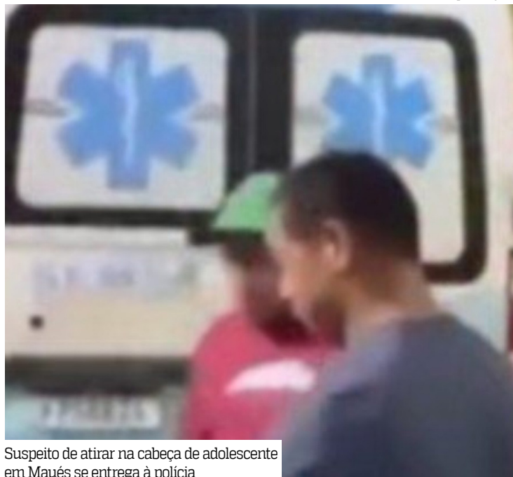
Suspeito de atirar na cabeça de adolescente em Maués se entrega à polícia