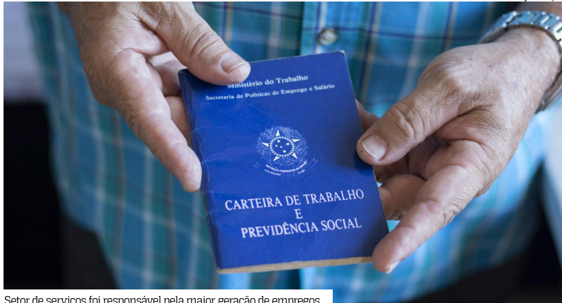
Setor de serviços foi responsável pela maior geração de empregos

Em seguida, aparecem construção civil, com 280 vagas, e indústria, com 199 vagas.