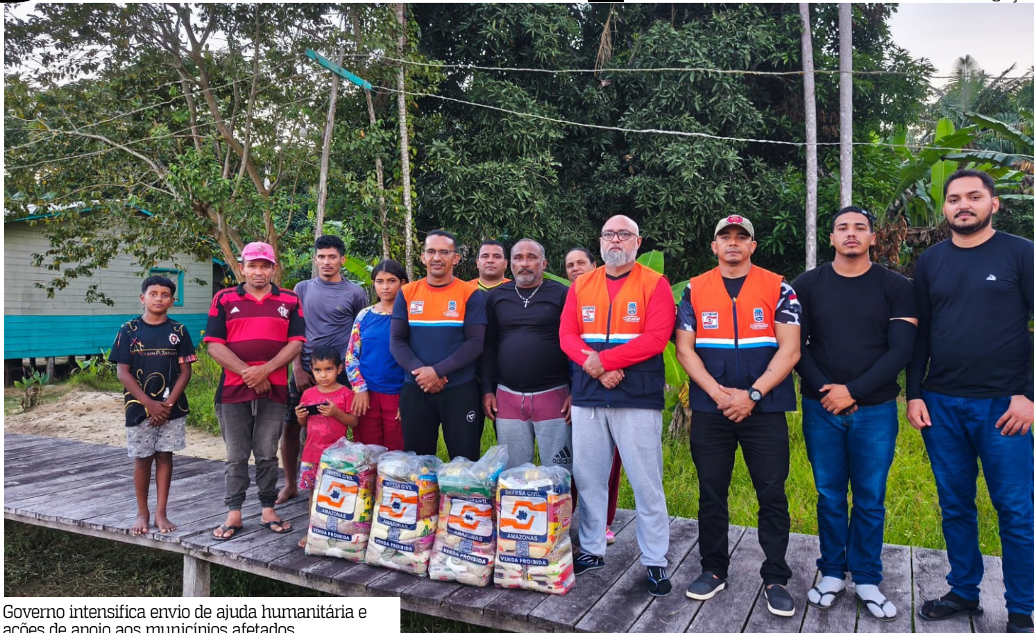
Governo intensifica envio de ajuda humanitária e ações de apoio aos municípios afetados

timativa é de 292.756 pessoas afetadas pelas inundações em todo o Amazonas.