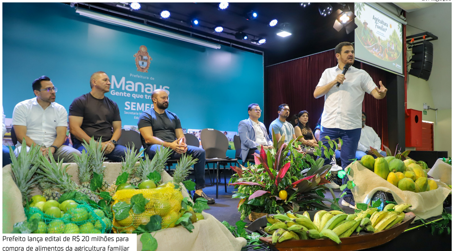
Prefeito lança edital de R$ 20 milhões para compra de alimentos da agricultura familiar

A estimativa é de que o novo chamamento público garanta a aquisição de aproximadamente 2.154 toneladas de alimentos para a merenda es-