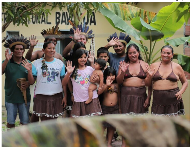
Produção amazônica conquista Award of Merit em festival nos EUA

O curta-metragem documental “Bayaroá” ampliou sua trajetória internacional ao conquistar o prêmio Award of Merit - Documentary Short, na edição de junho de 2026 do Best Shorts Competition, nos Estados Unidos. Além disso, a conquista reforça uma série de seleções, indicações e premiações já acumuladas pela produção.